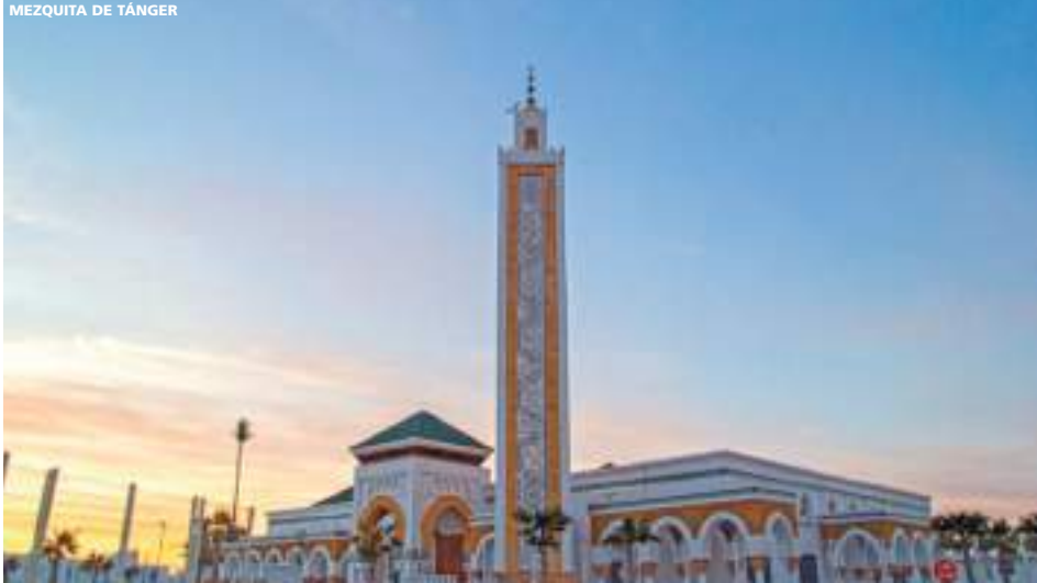
MEZQUITA DE TÁNGER

9 días (8 noches de hotel) desde 676 € 780 USD