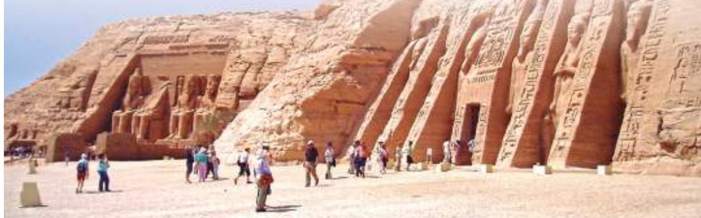
ABU SIMBEL - EGIPTO