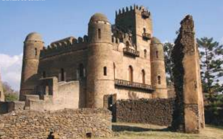
CASTILLO DE GONDAR

• Sábado • Desayuno + almuerzo + cena. Traslado al aeropuerto para tomar el vuelo regular con destino a Lalibela . (Vuelo previsto ET-123 AXU-LLI con salida a las 12,10 h. no incluido). Fundada a finales del S XII y conocida como la Jerusalén Negra está situada a 2.600 m de altitud y es sin duda