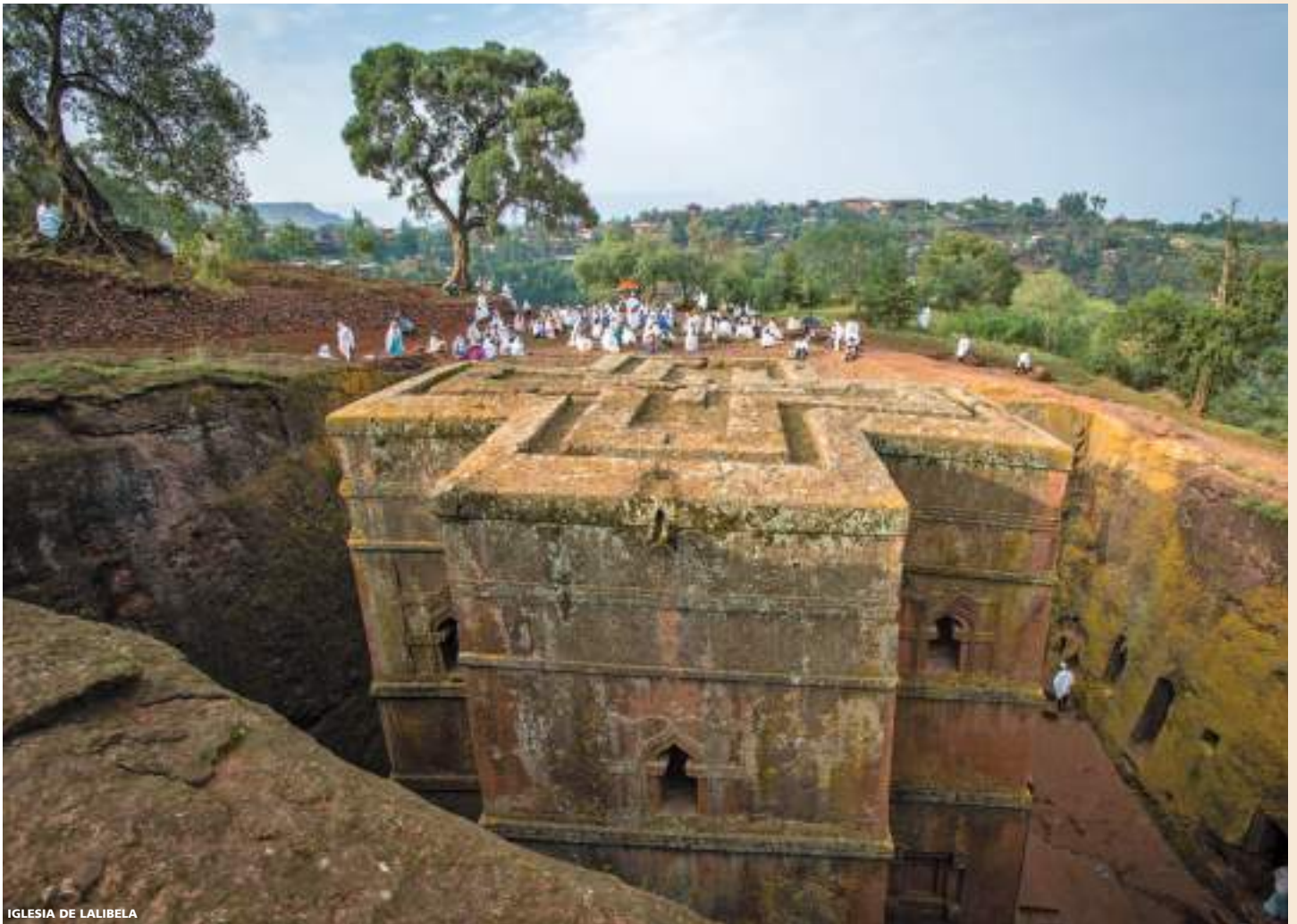
IGLESIA DE LALIBELA

una de las más impresionantes de Etiopía y está clasificada como Patrimonio de la Humanidad. Llegada y visita del colorido mercado semanal . Traslado al hotel. Por la tarde visita del primer grupo de las Iglesias de Rey Lalibela de las 11 Iglesias monolíticas literalmente excavadas en la roca y divididas en dos bloques separadas por el Río Yordanos (Jordán). El primer grupo simboliza la Jerusalén terrenal y el segundo grupo la celestial. Separada de ambos grupos se encuentra Bete Giorgis que simboliza el Arca de Noé y construida en honor de San Jorge patrón de Etiopía. En el interior de todas las iglesias se observan bellas pinturas murales de influencia bizantina, manuscritos, bastones de oración y numerosas antigüedades. Alojamiento.