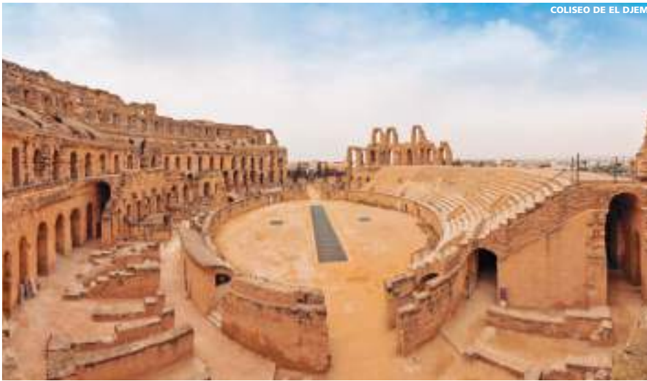
COLISEO DE EL DJEM

8 días (7 noches de hotel) desde 650 € 748 USD