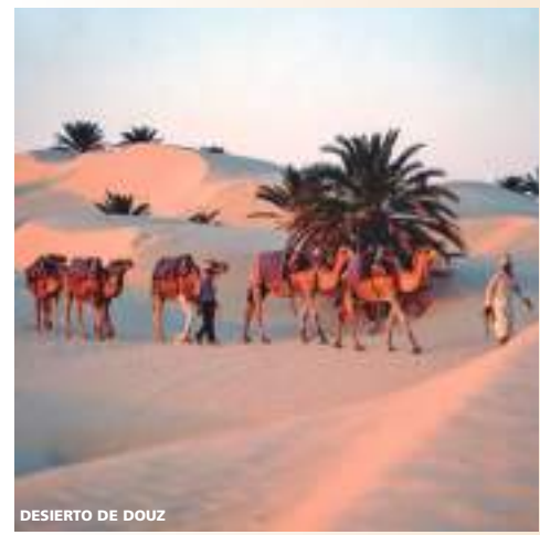
DESIERTO DE DOUZ