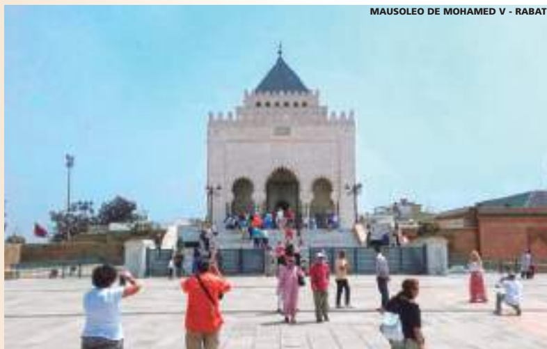
MAUSOLEO DE MOHAMED V - RABAT