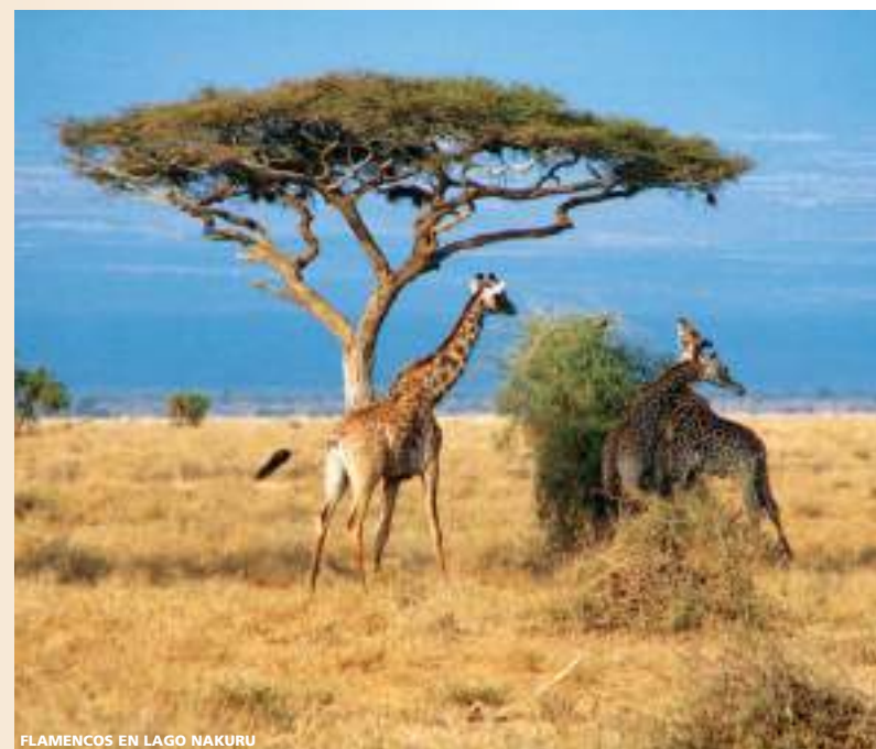
FLAMENCOS EN LAGO NAKURU

Nota: Rogamos consultar información relativa a visados y vacunas en su país de origen.