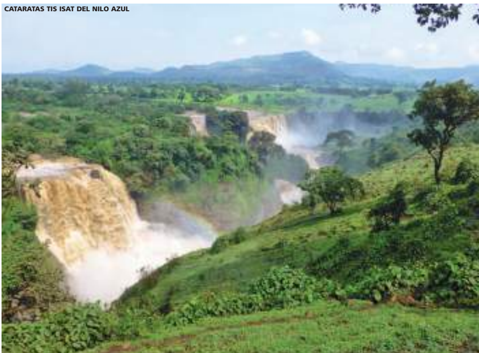
CATARATAS TIS ISAT DEL NILO AZUL

10 días (9 noches de hotel) desde 2.199 USD