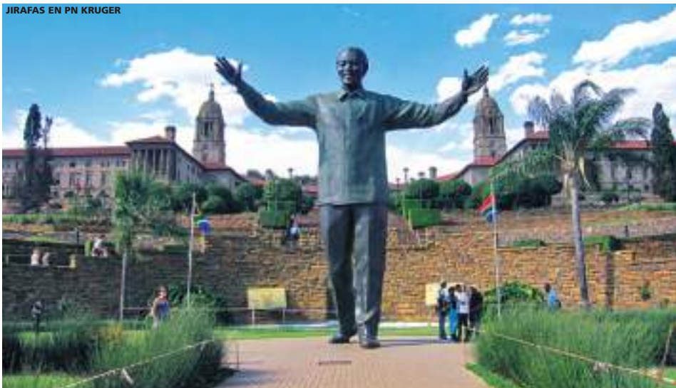
JIRAFAS EN PN KRUGER