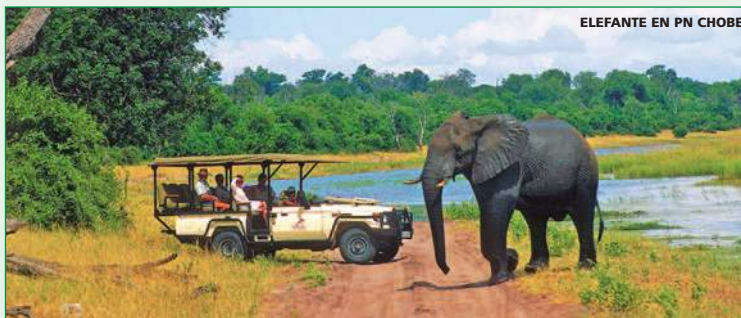
ELEFANTE EN PN CHOBE

Traslado al aeropuerto de Victoria Falls o de Livingstone.