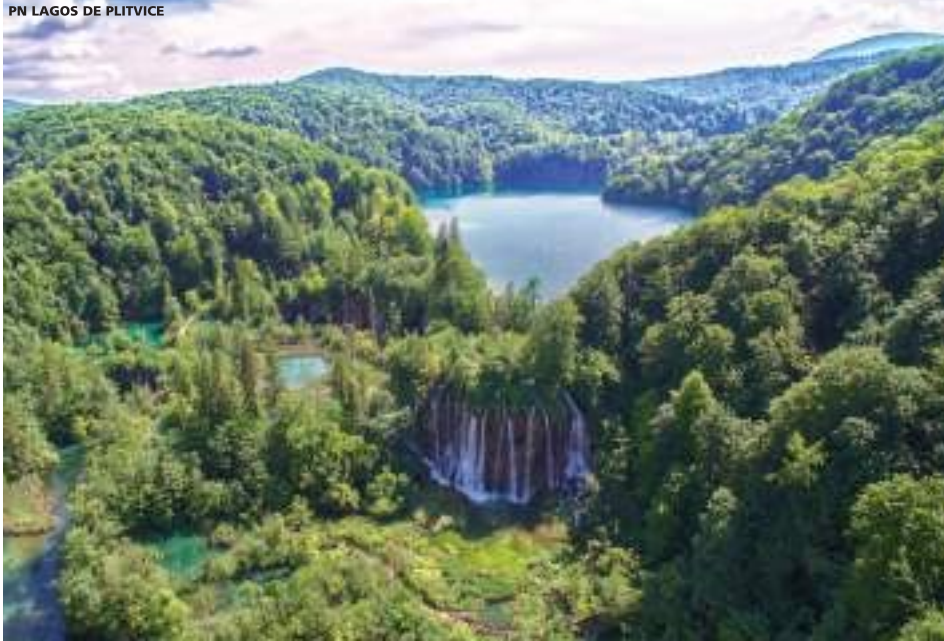
PN LAGOS DE PLITVICE