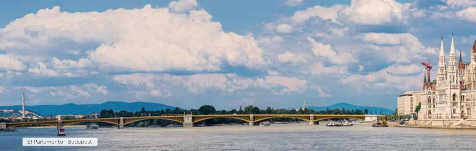
El Parlamento · Budapest