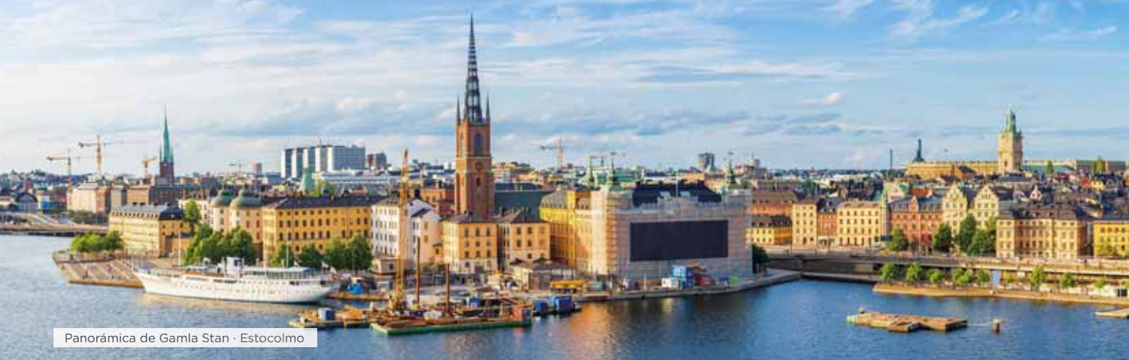
Panorámica de Gamla Stan · Estocolmo