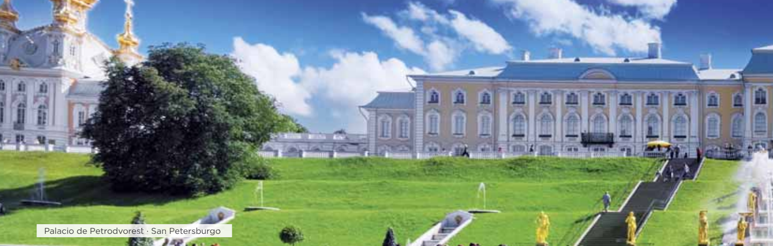
Palacio de Petrodvorest · San Petersburgo