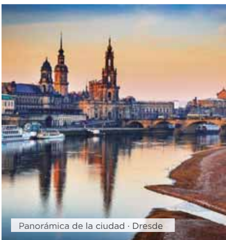
Panorámica de la ciudad · Dresde

Desayuno. En primer lugar, realizaremos un paseo en barco por el Sognefjord, conocido como el Fiordo de los Sueños, que no solo es el más largo de Noruega con sus más de 200 kilómetros, sino también el más profundo alcanzando los 1.300 metros de profundidad en algunos lugares. Desembarque en Gudvangen y continuación, pasando por el Valle de Voss hasta Bergen. Almuerzo. Visita panorámica en la que conoceremos entre otros lugares el Viejo Puerto de Bryggen, el antiguo barrio de los comerciantes de la Liga Hanseática y sus construcciones en madera, y subiremos a la colina Floyfjellet en funicular, para apreciar un sorprendente panorama de la ciudad y de su fiordo. Cena y alojamiento.