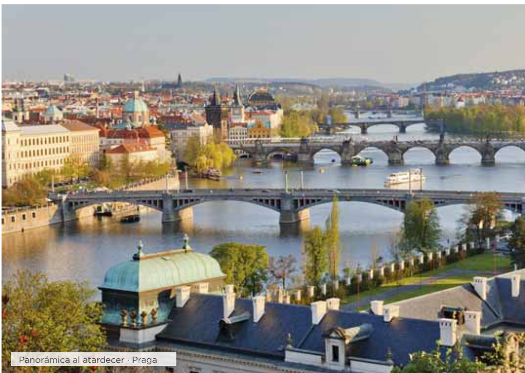
Panorámica al atardecer · Praga

Desayuno. Día libre o si lo desea podrá realizar una visita opcional de "Budapest Histórica", admirando el interior del Parlamento, uno de los edificios más emblemáticos de la ciudad. Durante esta visita tam-