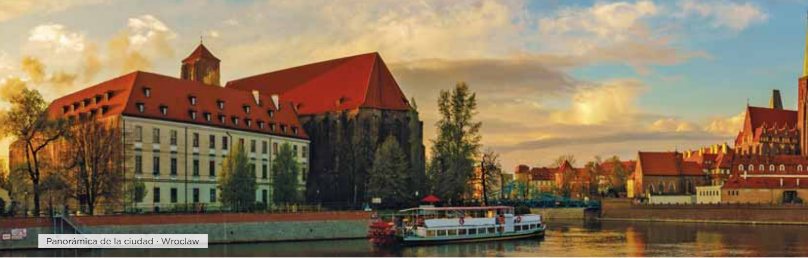
Panorámica de la ciudad · Wrocław