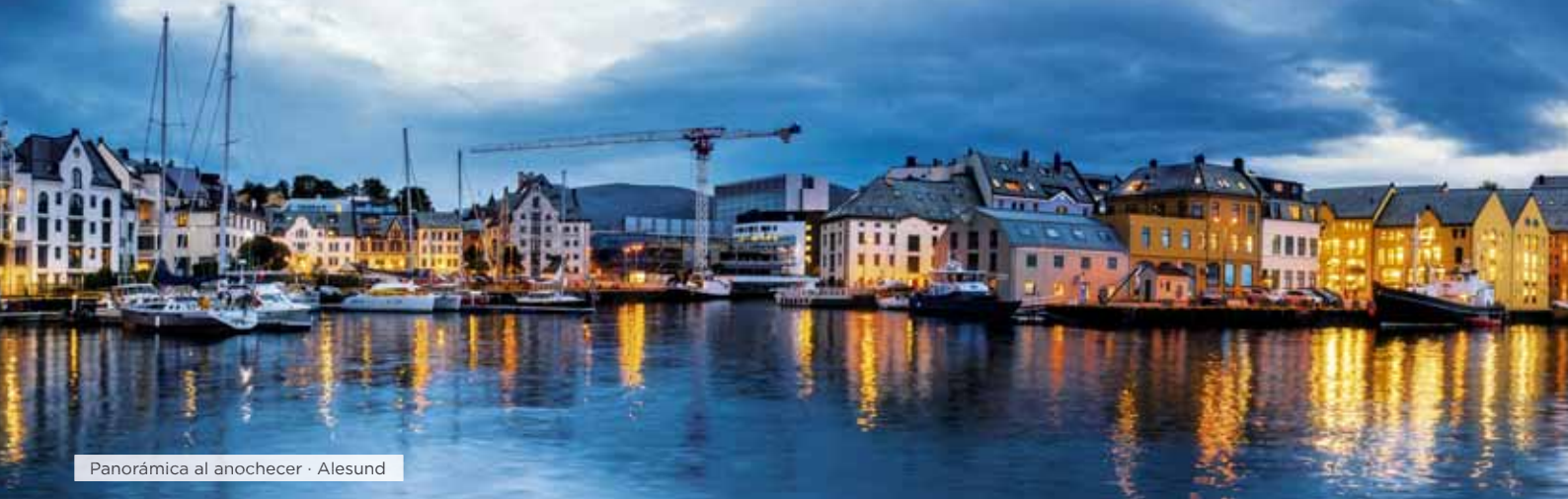
Panorámica al anochecer · Alesund