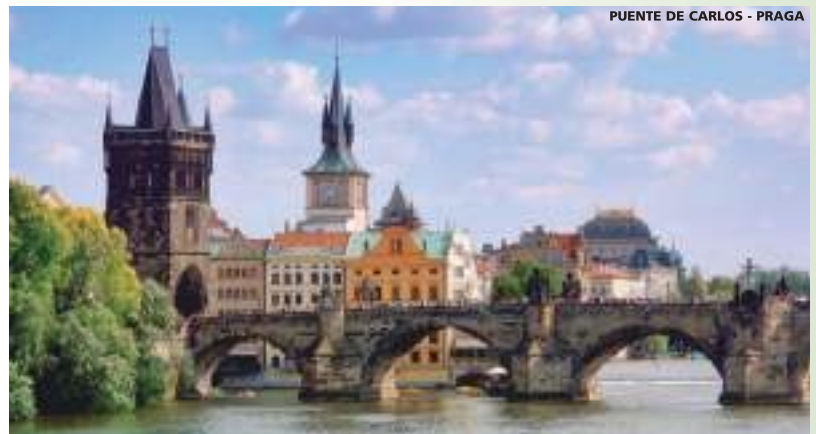
PUENTE DE CARLOS - PRAGA

Notas Importantes: El precio de las noches adicionales pre- y/o post-tour solo es válido hasta un máximo de 2 noches. Para más noches solo bajo petición. Las noches adicionales pre- y/o post-tour están sujetas a disponibilidad y no se garantiza que se realicen en el mismo hotel del grupo.