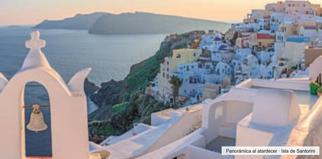
Panorámica al atardecer · Isla de Santorini