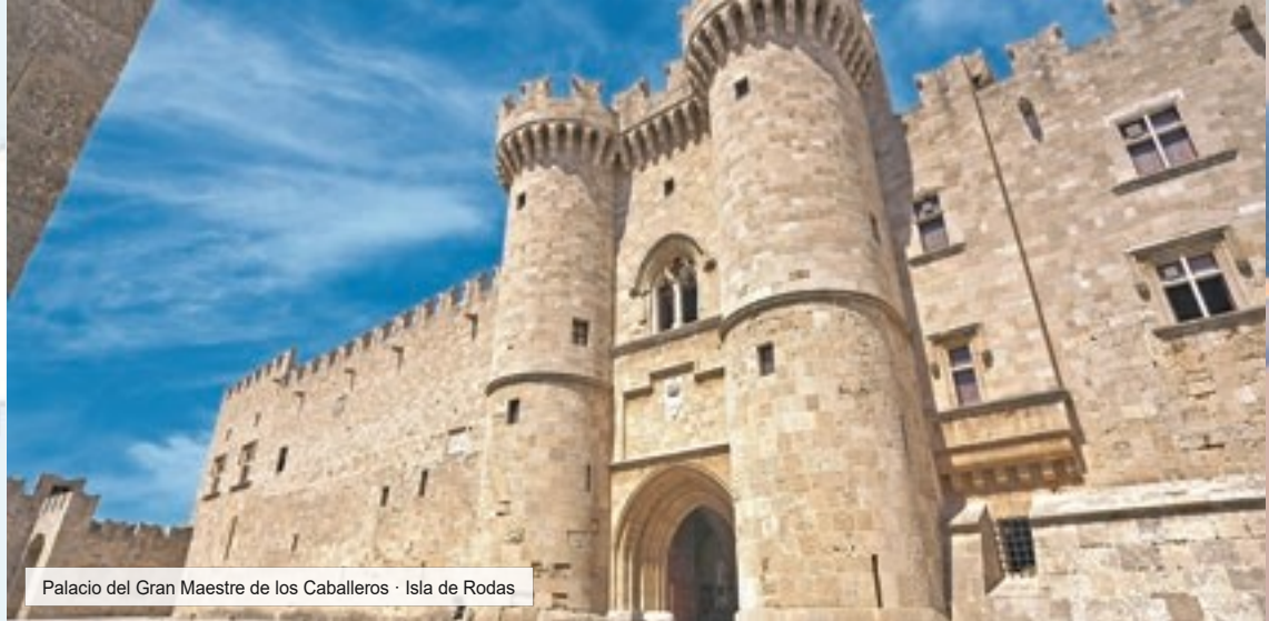
Palacio del Gran Maestre de los Caballeros · Isla de Rodas