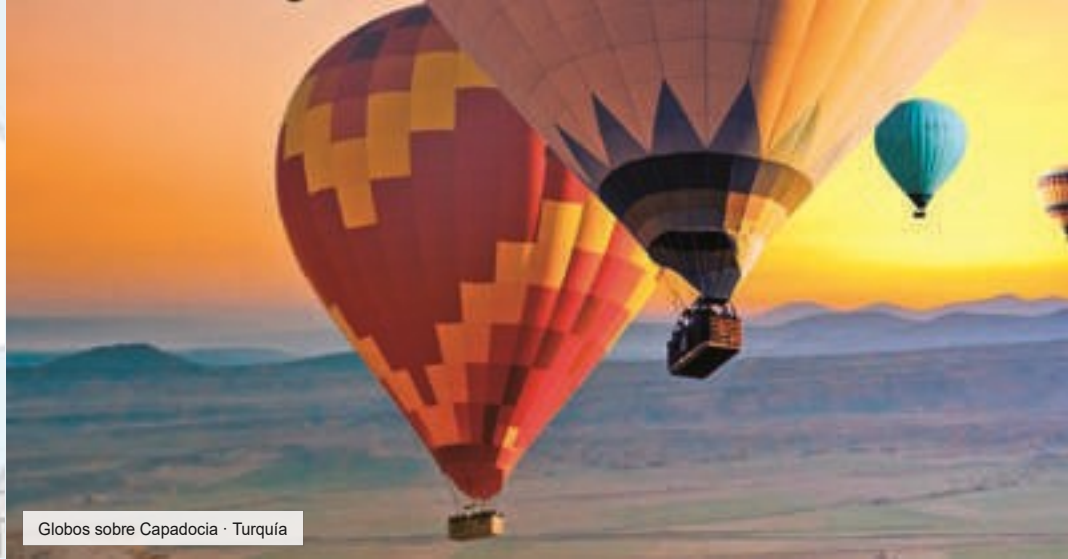
Globos sobre Capadocia - Turquía