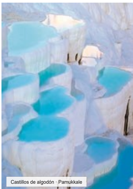
Castillos de algodón · Pamukkale

DÍA 10 LUN ESMIRNA - EFESO - PAMUKKALE PC Desayuno. Salida hacia Efeso, la ciudad mejor conservada de Asia Menor que tuvo una población de 250.000 habitantes y monopolizó la riqueza de Medio Oriente. Visitaremos el Templo Adriano, los Baños Romanos, la Biblioteca de Celso, el Odeón, el Teatro, etc. Visita de la Casa de la Virgen María, supuesta última morada de la Madre de Jesús, y un outlet de cuero. Almuerzo. Continuación a Pamukkale para visitar la antigua Hierapolis y el Castillo de Algodón, maravilla natural de gigantescas cascadas blancas, estalactitas, y piscinas naturales formadas a lo largo de los siglos por el paso de aguas de sales calcáreas procedentes de fuentes termales. Cena y Alojamiento.