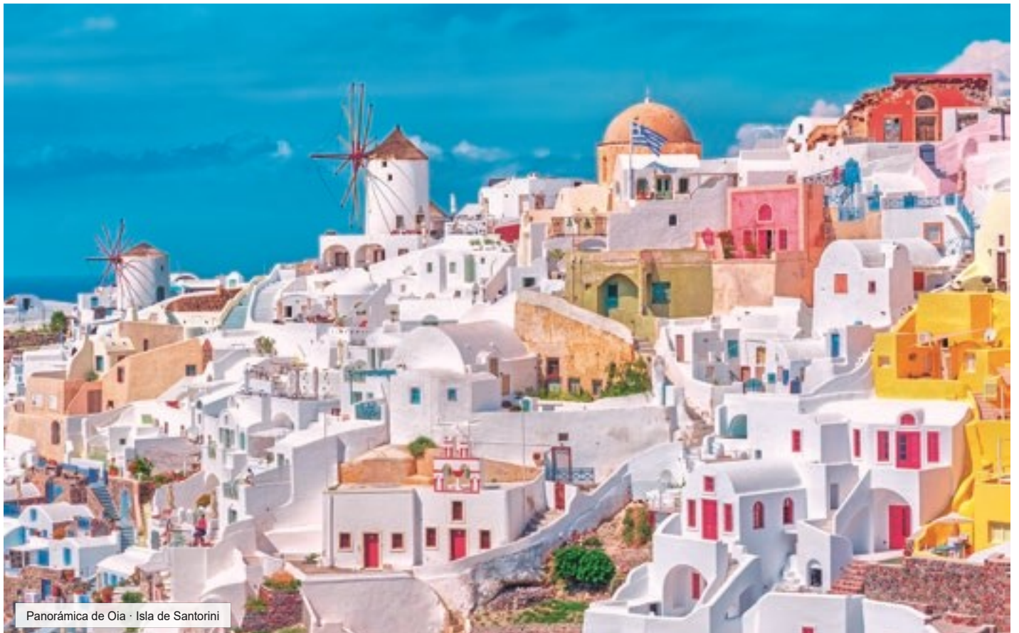
Panorámica de Oia - Isla de Santorini