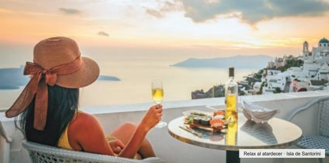
Relax al atardecer · Isla de Santorini