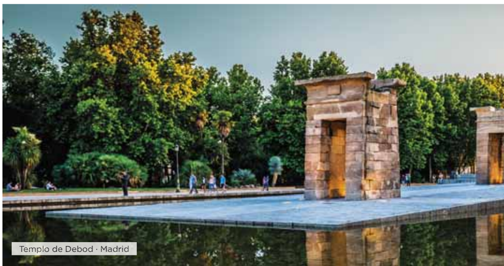
Templo de Debod · Madrid

Desayuno. Salida hacia Guimaraes, cuna de Portugal. Tiempo libre para conocer su castillo, el Palacio de los Duques de Braganza y el centro histórico con su entramado de calles peatonales. Continuación a