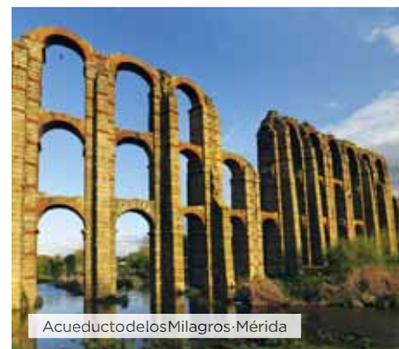
Acueducto de los Milagros Mérida