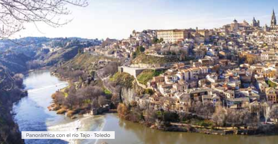
Panorámica con el río Tajo · Toledo