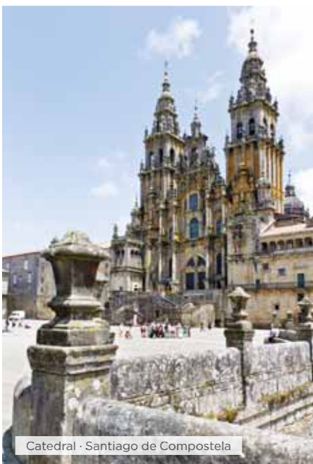
Catedral · Santiago de Compostela

Desayuno. Visita panorámica: Plaza de España, Ba-