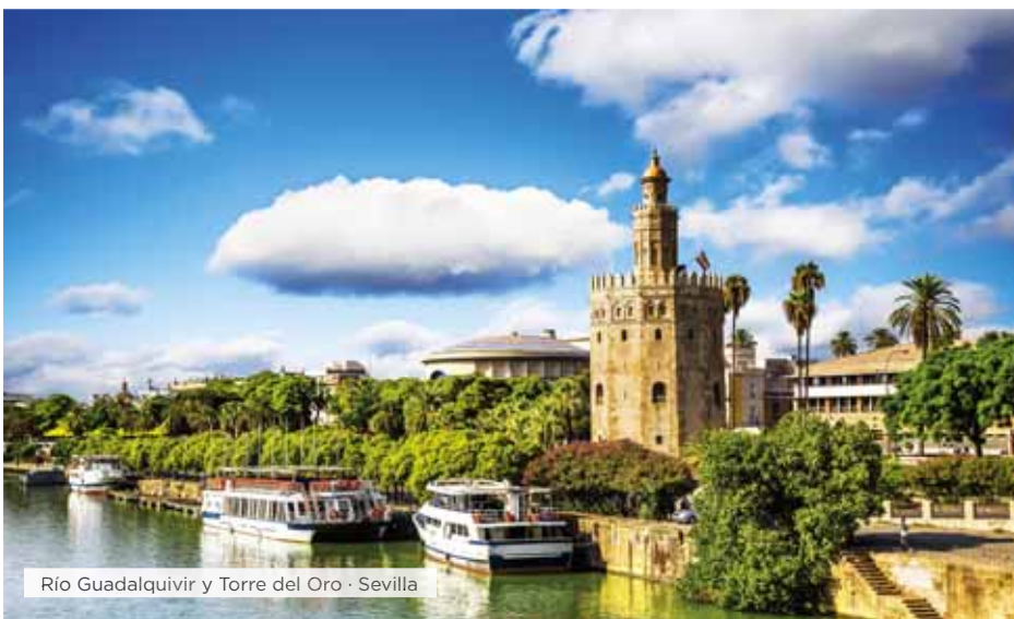
Río Guadalquivir y Torre del Oro · Sevilla

Desayuno. Visita panorámica: las Plazas de la Cibeles, de España y de Neptuno, la Gran Vía, Calle Mayor, exterior de la Plaza de toros de las Ventas, calle Alcalá,