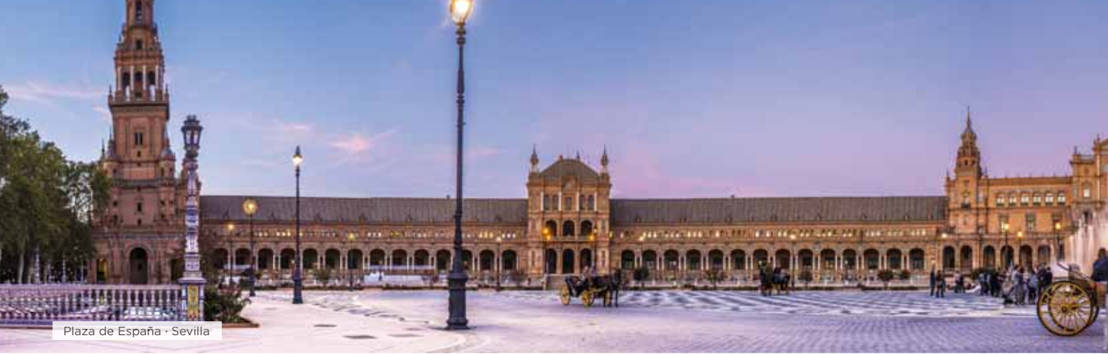
Plaza de España · Sevilla