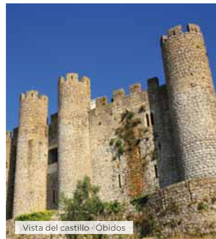
Vista del castillo · Óbidos

Hoteles alternativos y notas ver páginas 16 y 17.