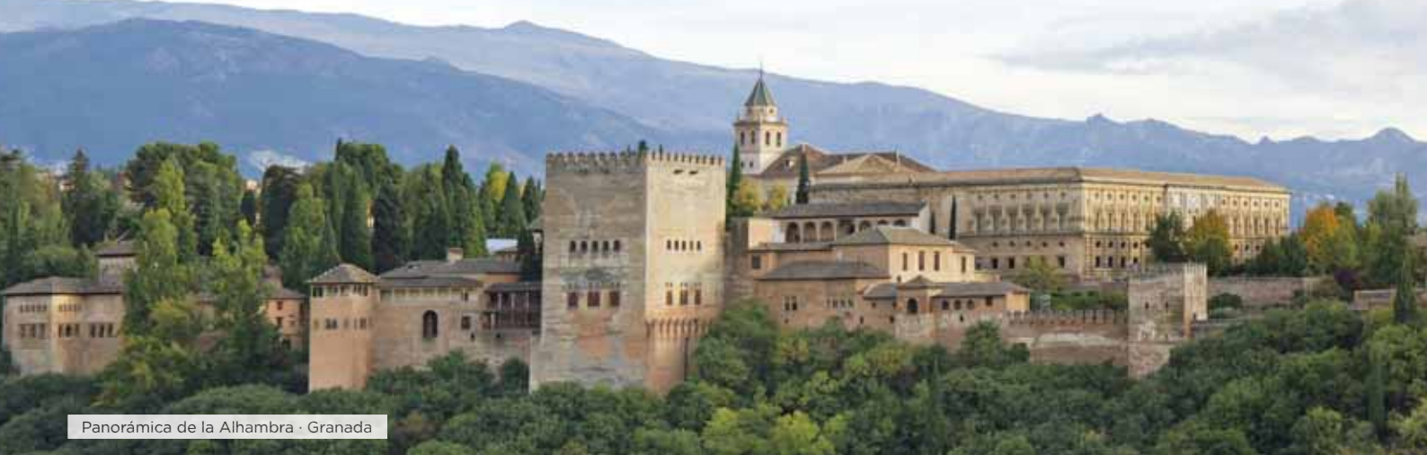
Panorámica de la Alhambra · Granada