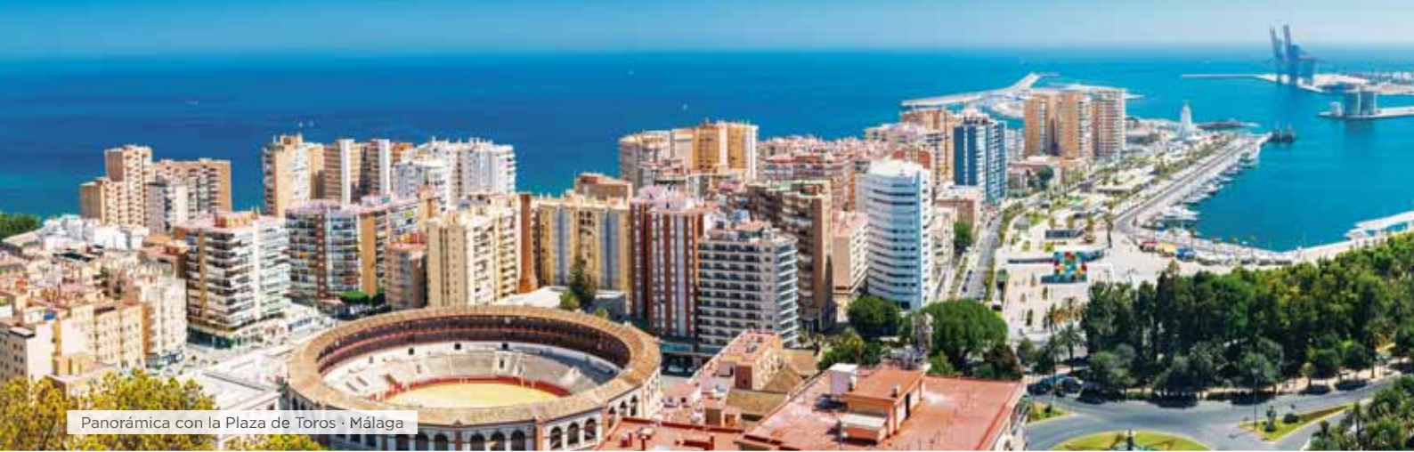
Panorámica con la Plaza de Toros · Málaga