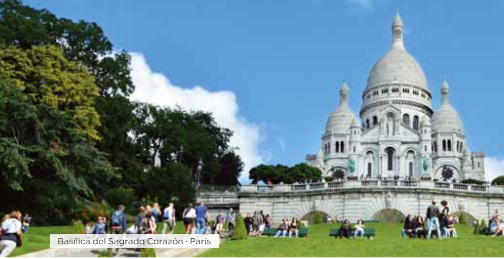
Basílica del Sagrado Corazón · París