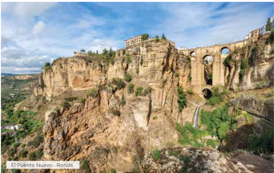
El Puente Nuevo · Ronda

Desayuno. Hoy nuestra ruta nos llevará a conocer uno de los pueblos blancos más bonitos de Andalucía: Ronda y dos de los destinos turísticos más prestigiosos de la Costa del Sol: Puerto Banús y Málaga. En primer lugar, nos dirigiremos a Ronda. Tiempo libre para admirar los lugares imprescindibles del lugar: el Puente Nuevo, la Puerta de Almogávar, la Iglesia del