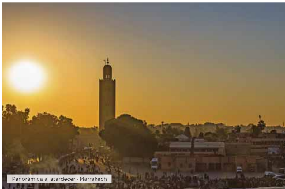
Panorámica al atardecer · Marrakech

Desayuno. Salida hacia el sur del país, pasando por el Medio Atlas, donde nos encontraremos la increíble ciudad de Ifrane, conocida como "la Suiza de Marruecos", también pasaremos por Azrou, importante centro de artesanía del país. Parada en Midelt para