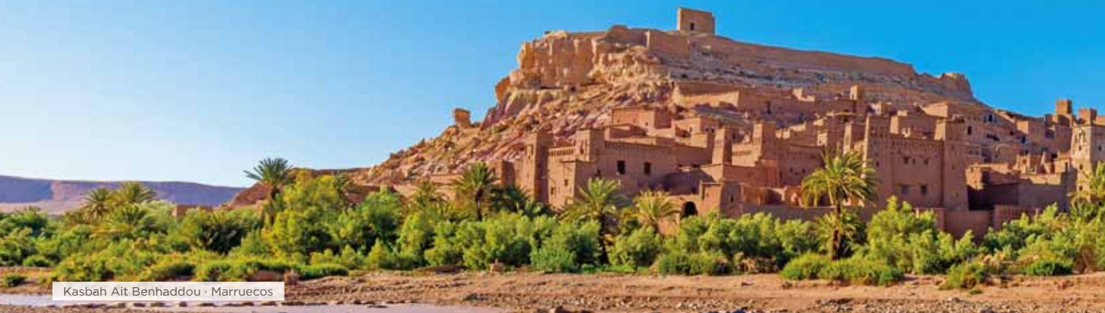
Kasbah Ait Benhaddou · Marruecos