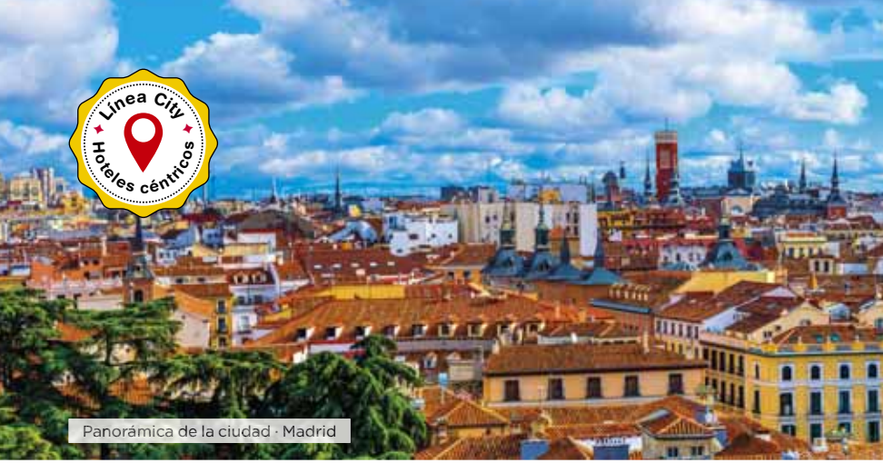
Panorámica de la ciudad · Madrid