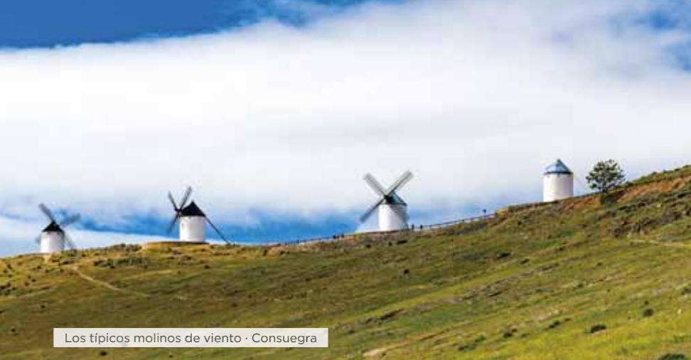
Los típicos molinos de viento · Consuegra