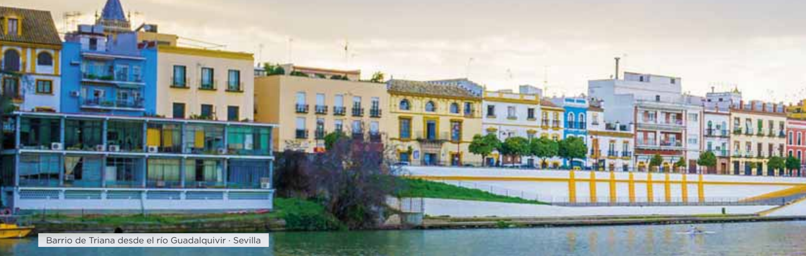
Barrio de Triana desde el río Guadalquivir · Sevilla