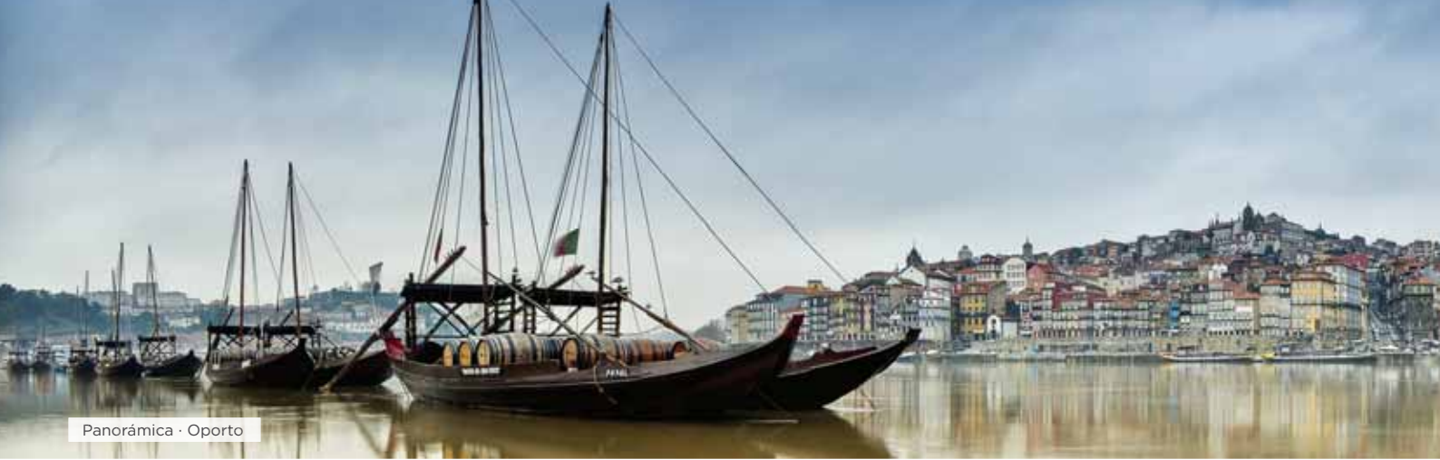
Panorámica · Oporto