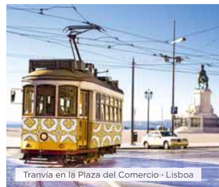
Tranvía en la Plaza del Comercio · Lisboa

Hoteles alternativos y notas ver páginas 16 y 17.