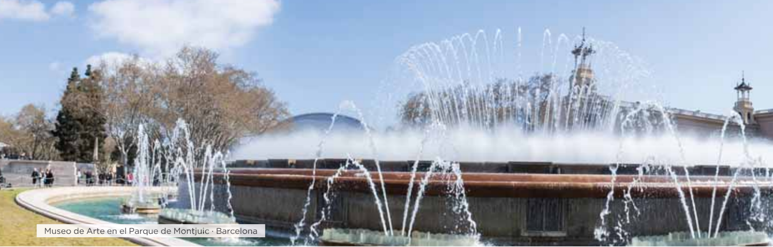
Museo de Arte en el Parque de Montjuic · Barcelona