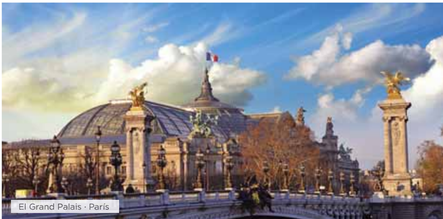
El Grand Palais · París

Desayuno. Tiempo libre hasta la hora del traslado al aeropuerto para tomar el vuelo a su ciudad de destino. Fin de nuestros servicios. ■