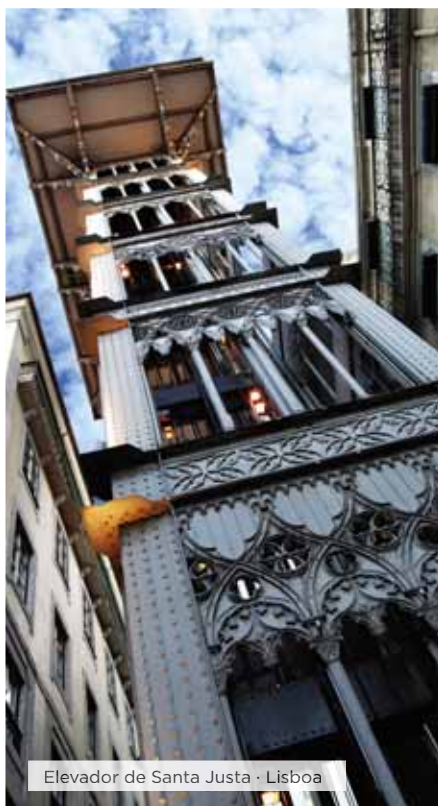
Elevador de Santa Justa · Lisboa

Desayuno. Visita panorámica de la capital del Reino de España, ciudad llena de contrastes, en la que con nuestro guía local conoceremos las Plazas de la Cibeles, de España y de Neptuno, la Gran Vía, Calle Mayor, exterior de la Plaza de toros de las Ventas, calle Alcalá, Paseo del Prado, Paseo de la Castellana, etc. Tarde libre para recorrer las numerosas zonas comerciales de esta capital o tomarse un descanso en algunas de las numerosas terrazas que