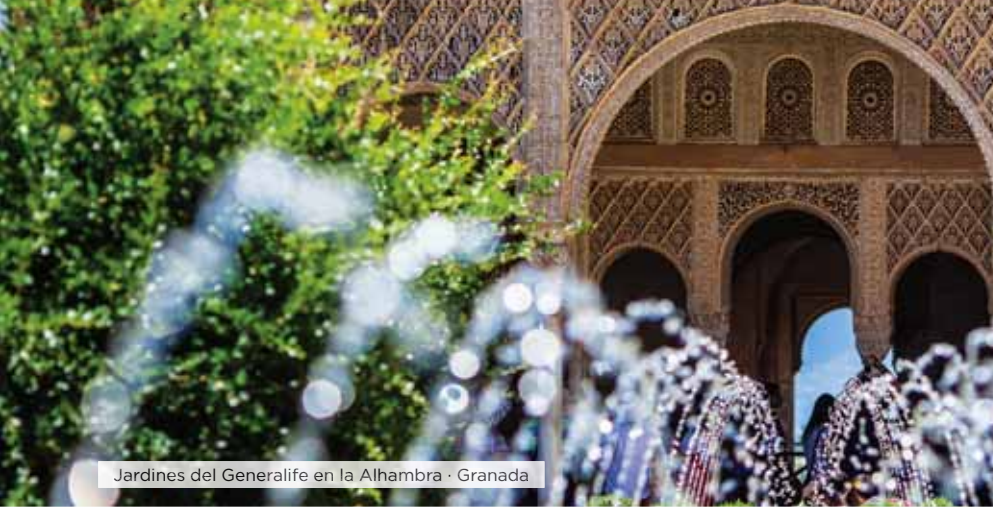
Jardines del Generalife en la Alhambra · Granada