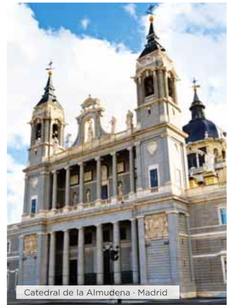
Catedral de la Almudena · Madrid

Hoteles alternativos y notas ver páginas 16 y 17.