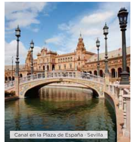
Canal en la Plaza de España · Sevilla