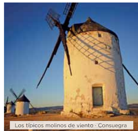
Los típicos molinos de viento - Consuegra