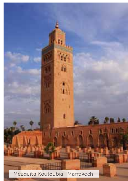
Mezquita Koutoubia · Marrakech