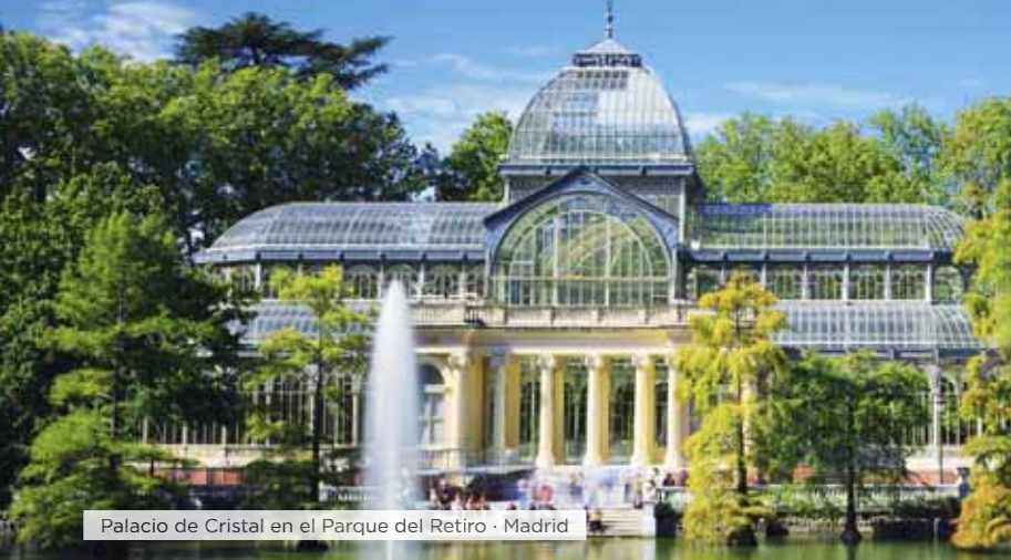
Palacio de Cristal en el Parque del Retiro · Madrid