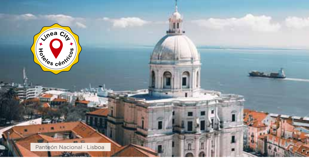
Panteón Nacional · Lisboa