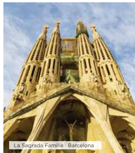
La Sagrada Familia · Barcelona

Hoteles alternativos y notas ver páginas 16 y 17.