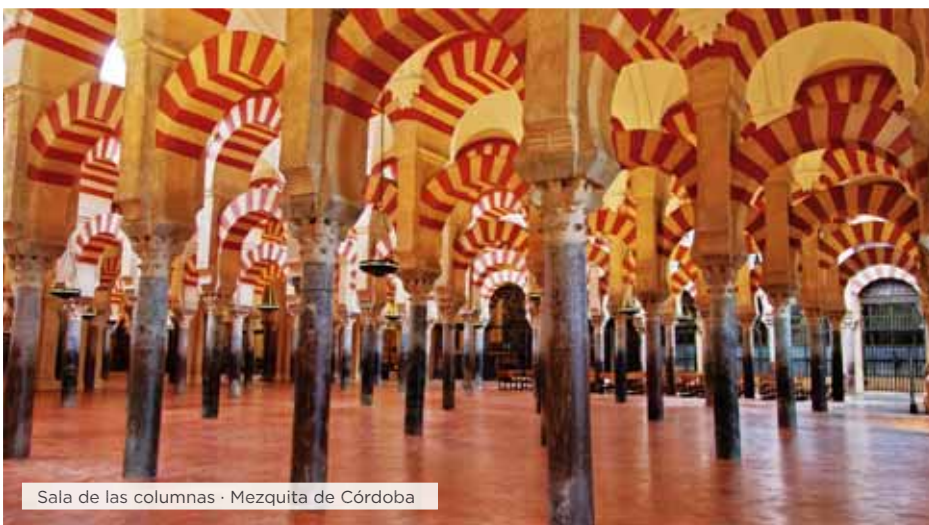
Sala de las columnas · Mezquita de Córdoba

Desayuno. Salida hacia Guimarães, cuna de Portugal. Tiempo libre para conocer su castillo, el Palacio de los Duques de Braganza y el centro histórico. Continuación a Vila Real, ciudad fundada por campesinos y pastores para crear un lugar cercano de las cosechas en donde residir. Visitaremos el Solar de Mateus, donde se produce el vino del mismo nombre. Conoceremos este encantador palacio barroco rodeado de viñedos y con esplendidos jardines con una gran variedad de especies exóticas. Nuestra ruta continuará por el corazón del Valle del Duero, entre los viñedos en terrazas que se extienden entre Pinhao y Peso da Regua, admirando paisajes espectaculares, con colinas que llegan hasta las margenes del río. Continuación a Coimbra. Cena y alojamiento.