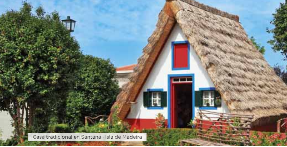
Casa tradicional en Santana · Isla de Madeira