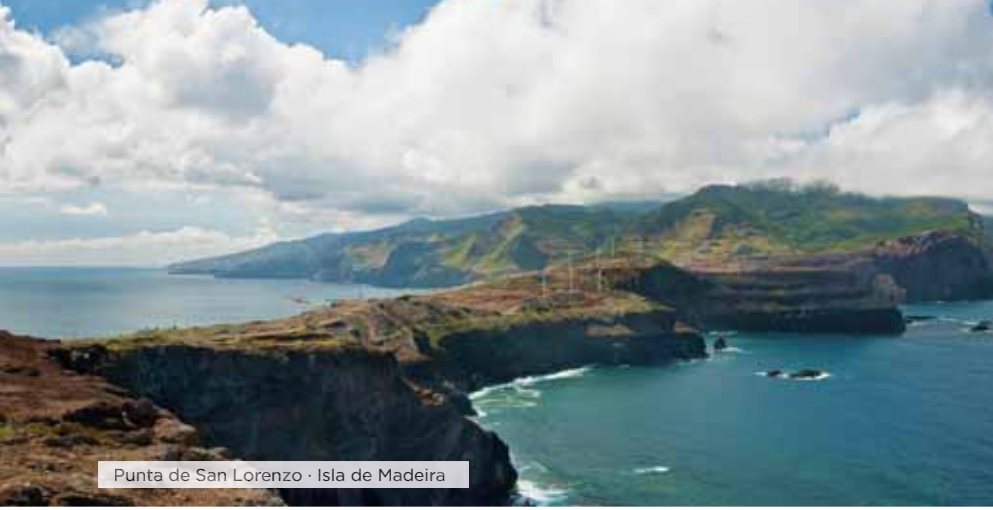
Punta de San Lorenzo · Isla de Madeira