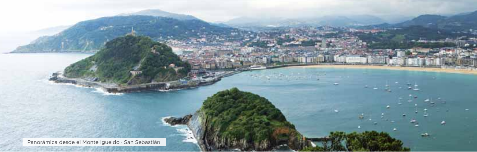
Panorámica desde el Monte Igueldo · San Sebastián