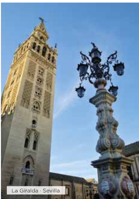
La Giralda · Sevilla

Desayuno. Salida hacia Córdoba, capital de la provincia Bética durante el Imperio Romano y del Califato de Córdoba durante el periodo musulmán en España. Tiempo libre para conocer el centro histórico de la ciudad y su Mezquita. Visita opcional guiada de la misma. Continuación a Sevilla, con obras de arte que marcan las diferentes culturas que por ella pasaron. Cena y alojamiento .