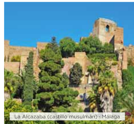
La Alcazaba (castillo musulmán) · Málaga

Hoteles alternativos y notas ver páginas 16 y 17.