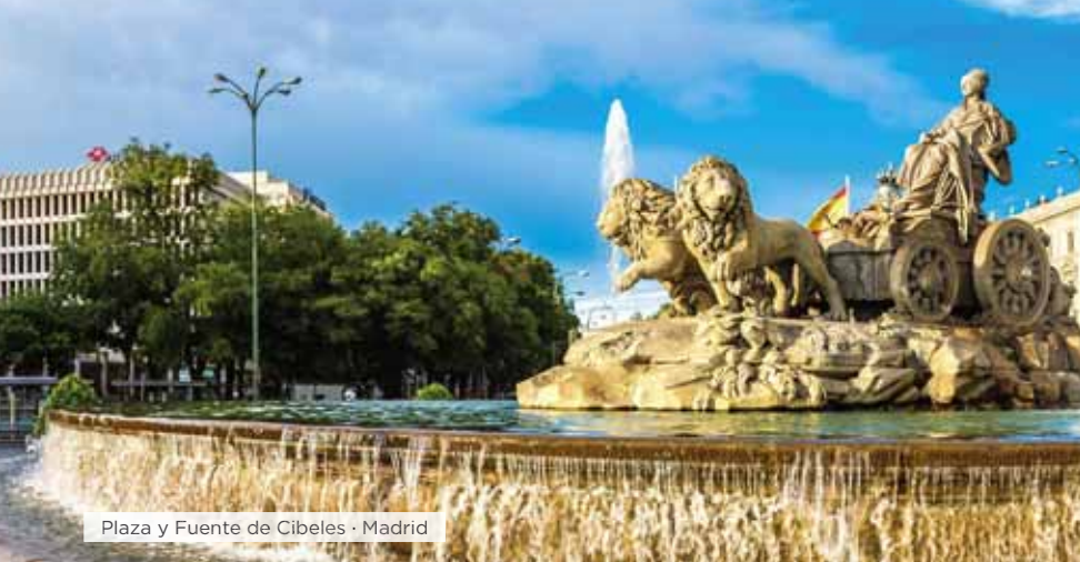
Plaza y Fuente de Cibeles · Madrid