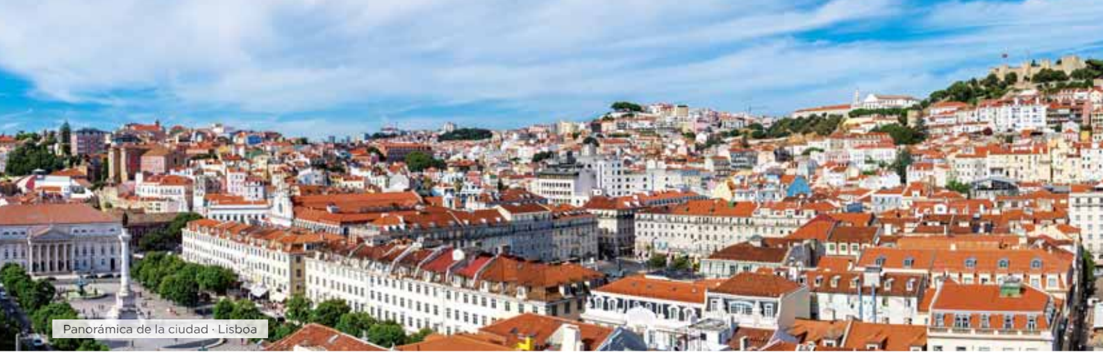
Panorámica de la ciudad · Lisboa