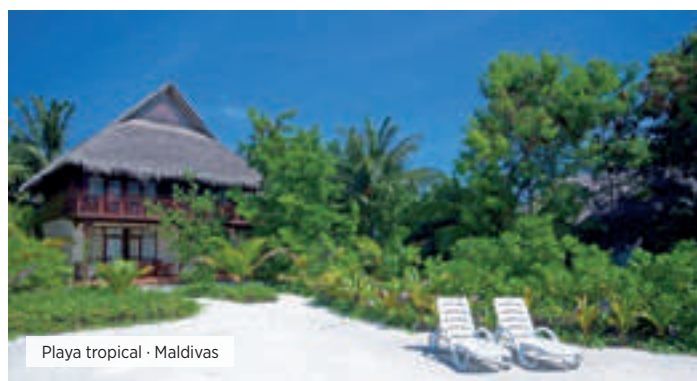
Playa tropical · Maldivas

Desayuno. Día libre hasta la hora de traslado al aeropuerto. Fin de nuestros servicios.