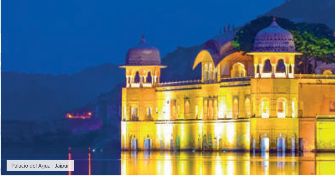
Palacio del Agua · Jaipur