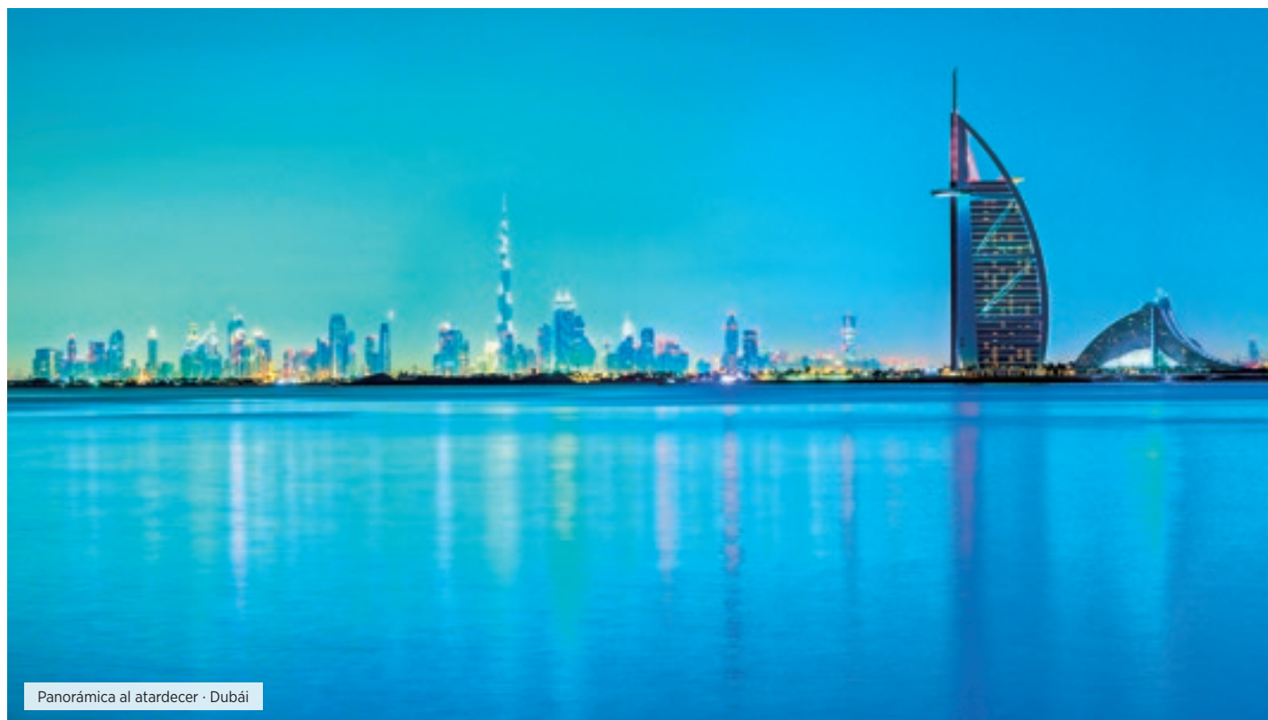
Panorámica al atardecer · Dubái

MP Muy temprano en la mañana, visita del monumento arquitectónico más famoso del mundo, el Taj Mahal, construido entre 1.631 y 1.654 a orillas del río Yamuna, por el emperador musulmán Shah Jahan en honor de su esposa favori-