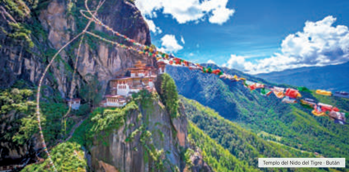
Templo del Nido del Tigre - Bután