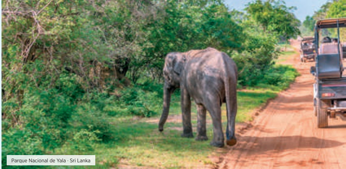
Parque Nacional de Yala · Sri Lanka