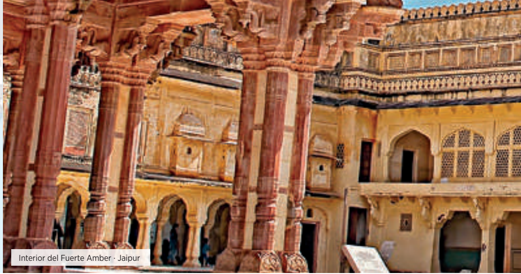
Interior del Fuerte Amber · Jaipur