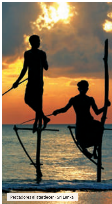
Pescadores al atardecer · Sri Lanka

Desayuno. Salida por la costa Sur hasta Tissamaharama. Almuerzo. Visita en 4x4 al Parque Nacional de Yala con una variedad de ecosistemas entre los que destacan bosques húmedos y humedales marinos. Es una de las 70 áreas más importantes para las aves en Sri Lanka, con 215 especies, incluyendo seis endémicas del país. El número de mamíferos que se ha registrado en el parque es de 44 diferentes tipos y tiene una de las mayores densidades de leopardos. Cena y Alojamiento.