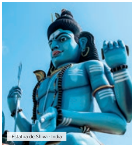
Estatua de Shiva · India

DÍA 9 NUEVA DELHI Desayuno. Tiempo libre hasta la hora del traslado al aeropuerto y Fin de nuestros servicios.