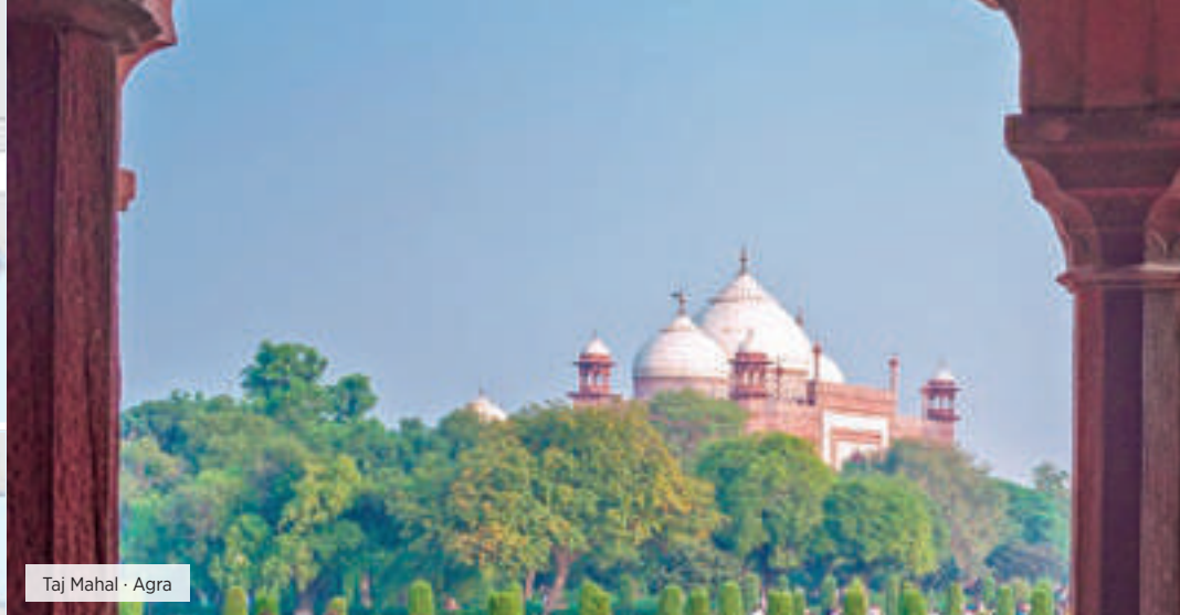
Taj Mahal · Agra