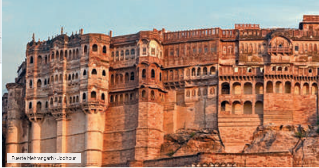
Fuerte Mehrangarh · Jodhpur