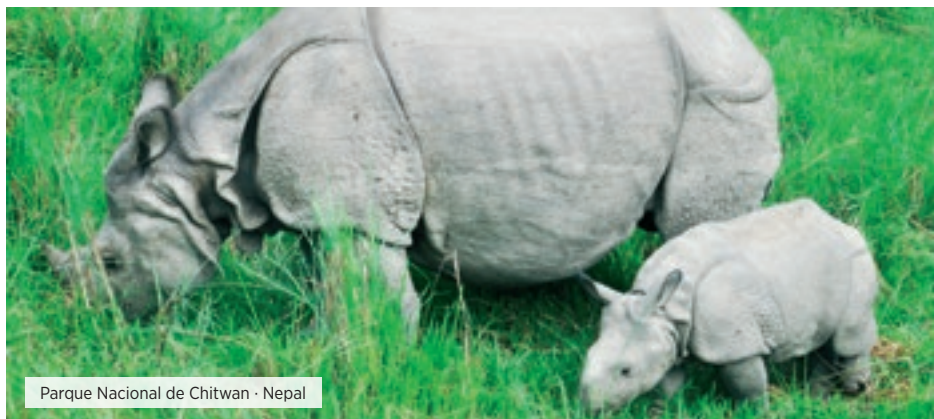
Parque Nacional de Chitwan · Nepal

Desayuno. Día libre hasta la hora del traslado al aeropuerto de Katmandú para embarcar en su vuelo. Fin de nuestros servicios. ■