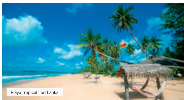
Playa tropical · Sri Lanka

Desayuno. Día libre hasta la hora del traslado al aeropuerto. Fin de nuestros servicios.