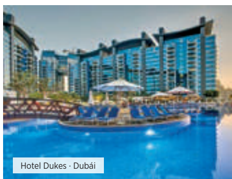
Hotel Dukas · Dubái

Desayuno. Traslado al aeropuerto con asistencia de habla hispana. Fin de nuestros servicios.