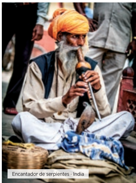
Encantador de serpientes - India

IMPORTANTE: En esta opción es necesario gestionar visa de doble entrada a India.