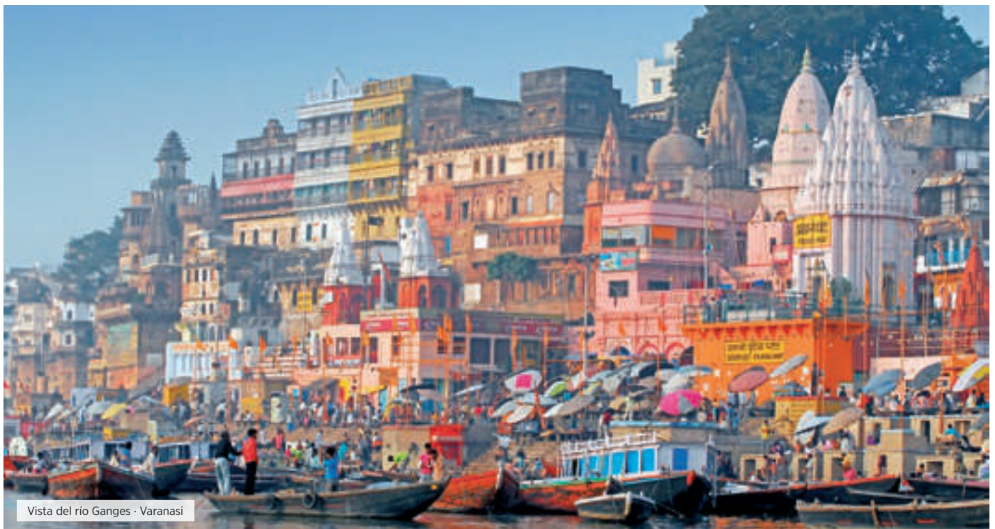
Vista del río Ganges · Varanasi

Muy temprano en la mañana, visita del monumento arquitectónico más famoso del mundo, el Taj Mahal, construido entre 1.631 y 1.654 a orillas del río Yamuna, por el emperador musulmán Shah Jahan en honor de su esposa favorita, Arjumand Bano Begum, más conocida como Mumtaz Mahal. Regreso al hotel para tomar el Desayuno. Visita de Agra, incluyendo el Fuerte Rojo, construido en piedra de arenisca roja por el emperador mongol Akbar entre 1.565 y 1.573. Es un recinto amurallado, encerrando en su interior un impresionante conjunto