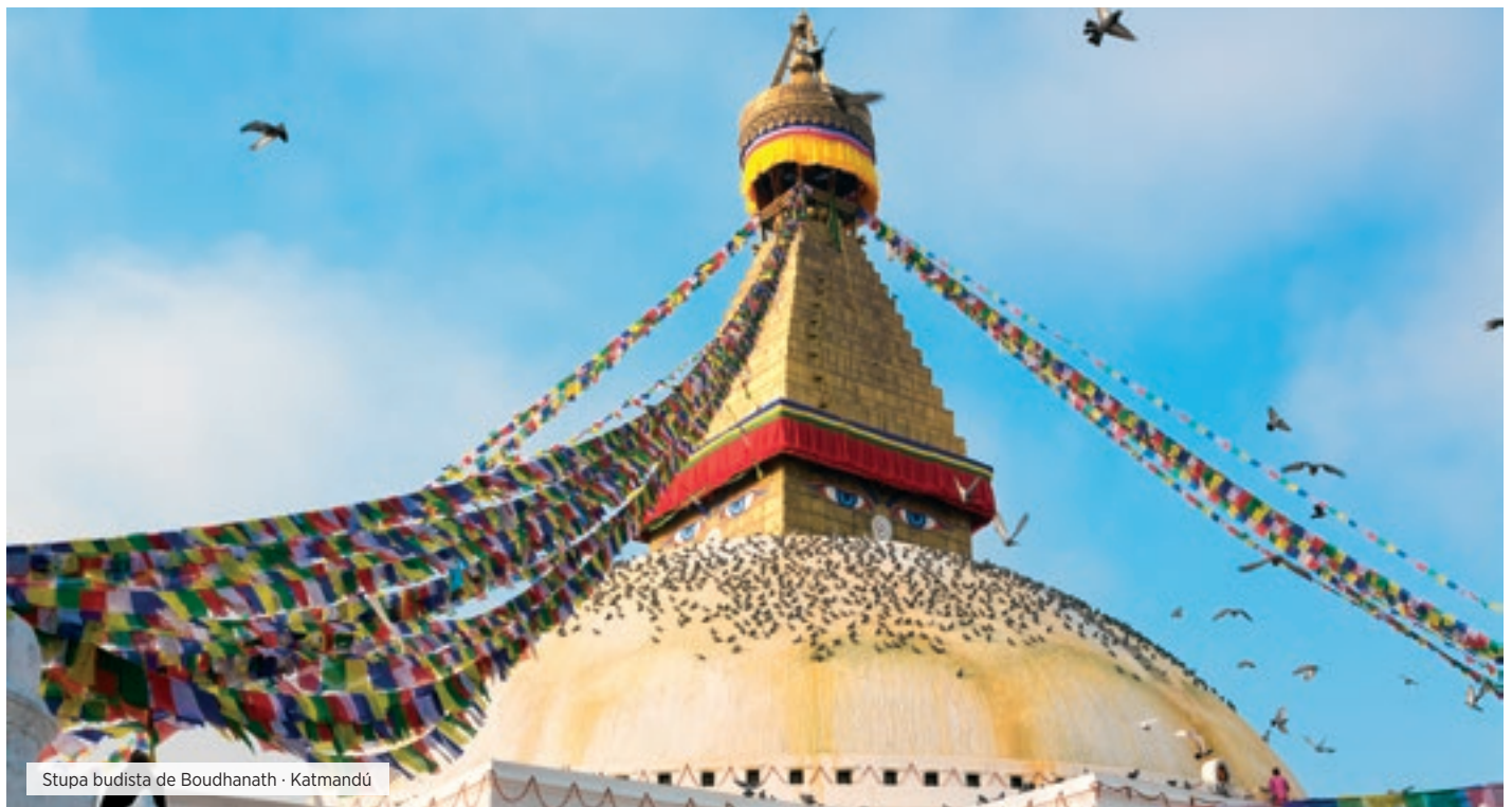
Stupa budista de Boudhanath - Katmandú

MP Muy temprano en la mañana, visita del monumento arquitectónico más famoso del mundo, el Taj Mahal, construido entre 1631 y 1654 a orillas del río Yamuna, por el emperador musulmán Shah Jahan en honor de su esposa favori-