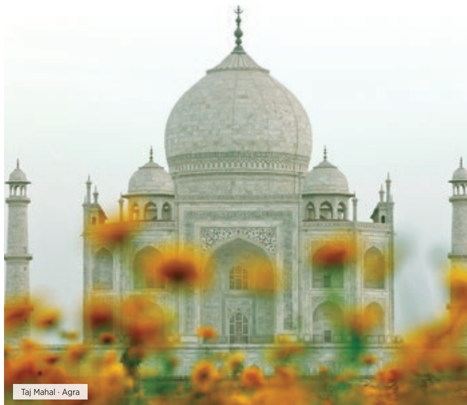
Taj Mahal · Agra

Desayuno. Tiempo libre hasta la hora del traslado al aeropuerto. Fin de nuestros servicios. ■