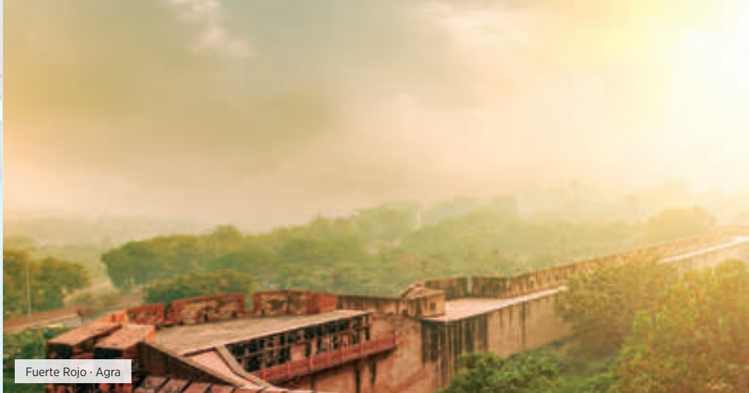
Fuerte Rojo - Agra