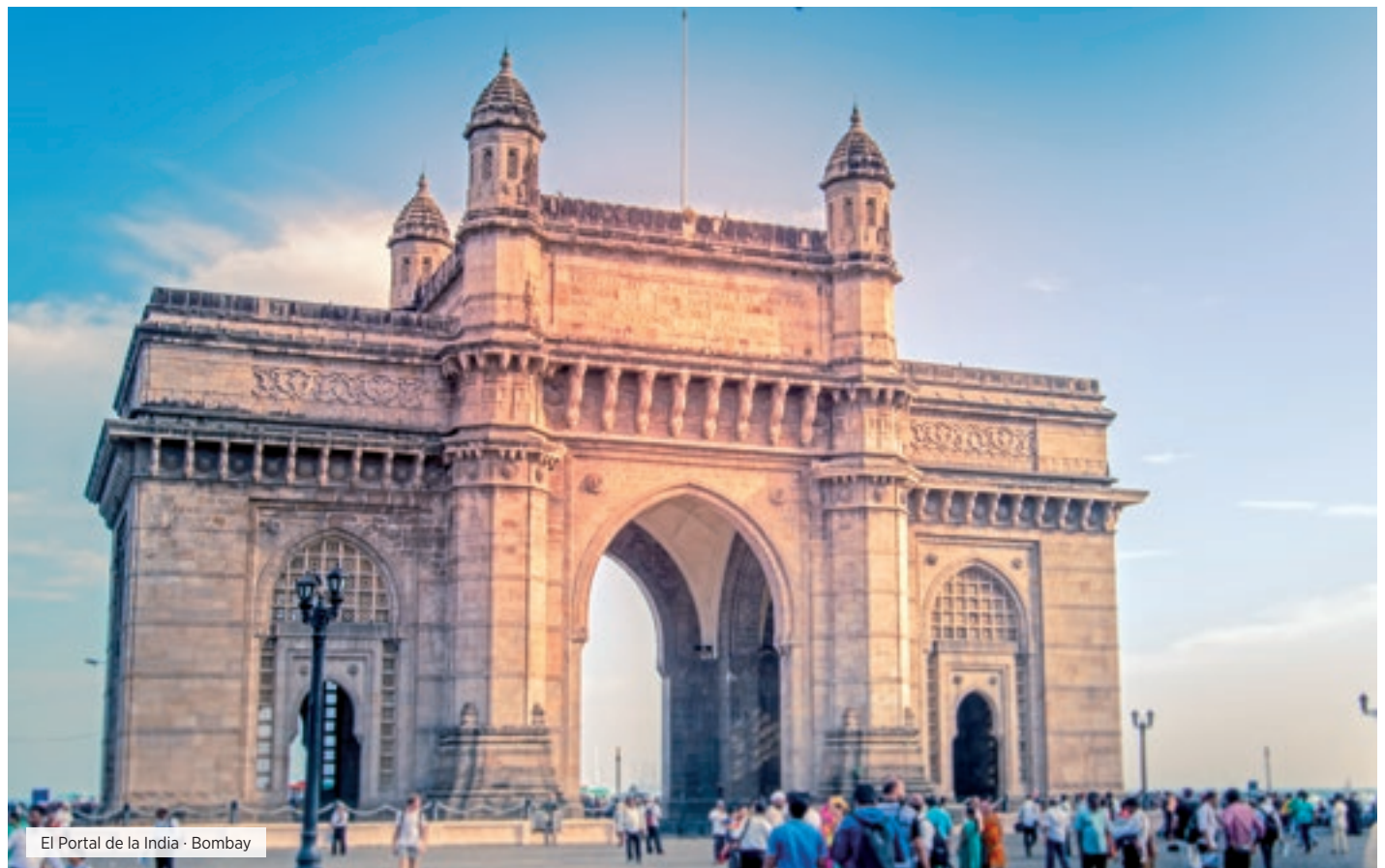
El Portal de la India · Bombay