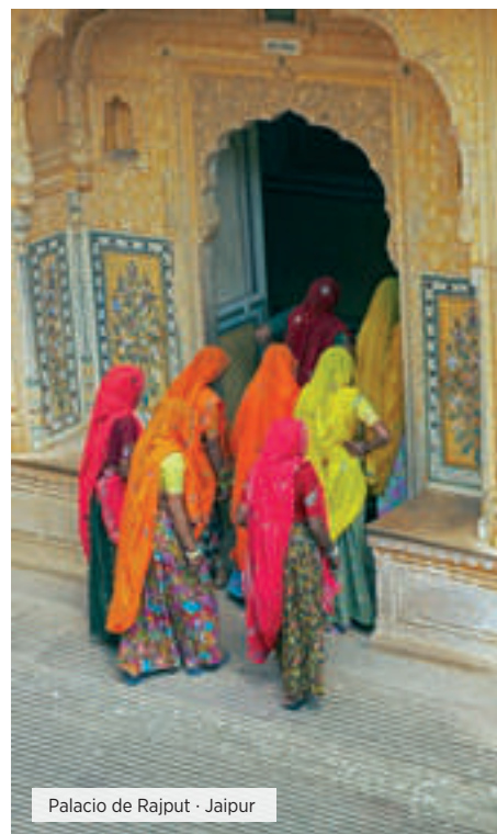
Palacio de Rajput · Jaipur

Desayuno. Tiempo libre hasta la hora del traslado al aeropuerto para tomar su vuelo de regreso. Fin de nuestros servicios. ■