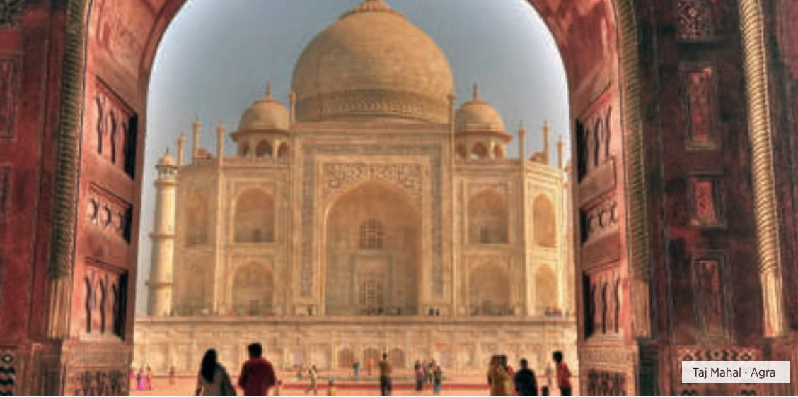
Taj Mahal · Agra