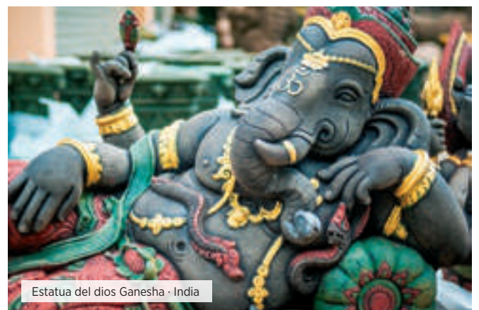
Estatua del dios Ganesha · India

Precios no válidos del 24 al 31 Diciembre 2019. Consultar.