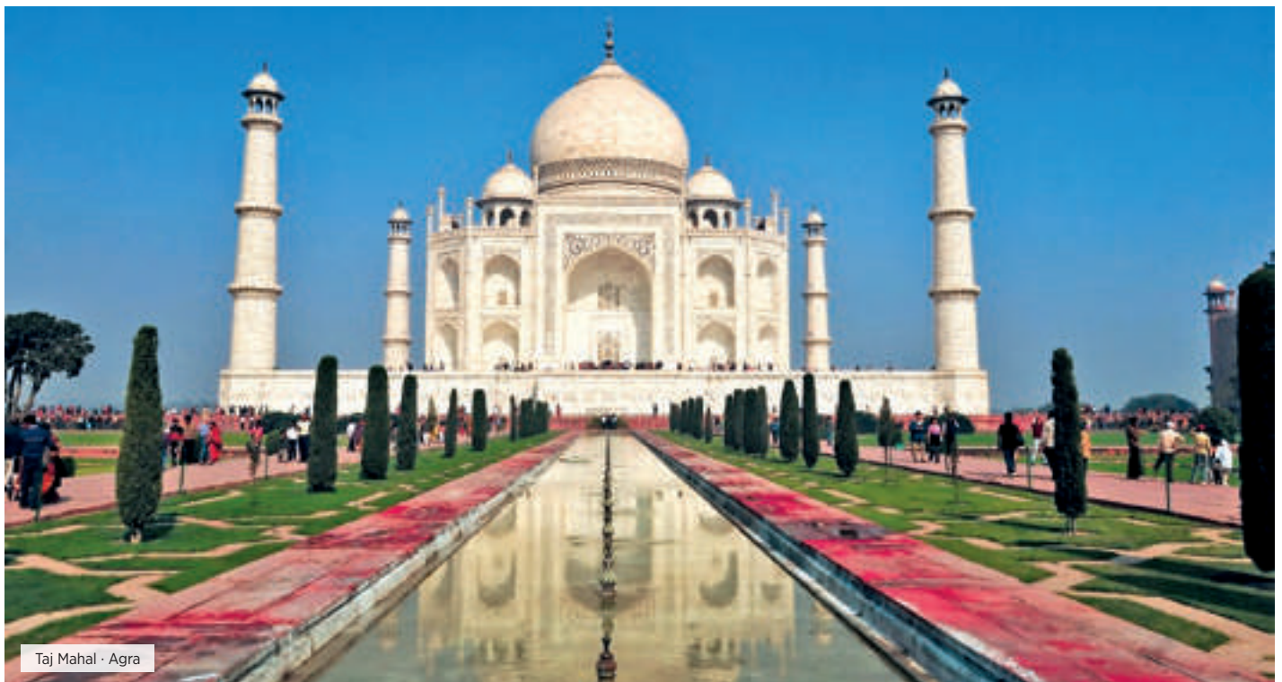
Taj Mahal · Agra