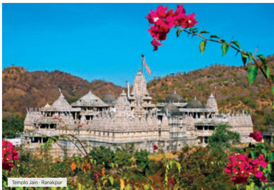
Templo Jain · Ranakpur