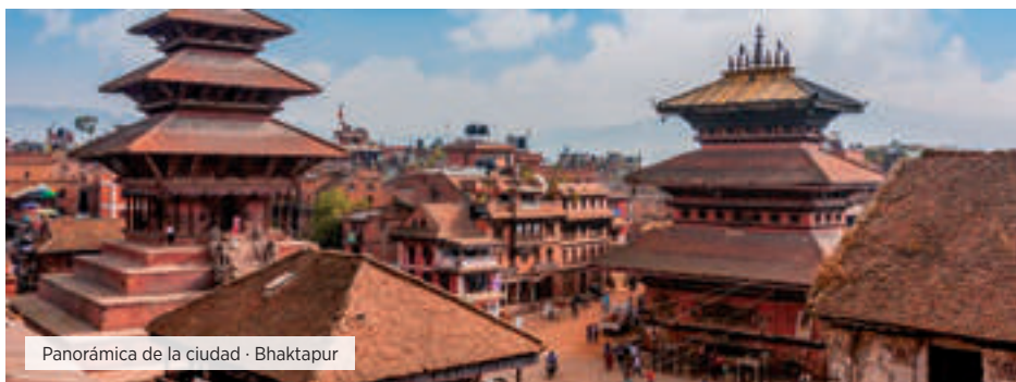
Panorámica de la ciudad - Bhaktapur

Consultar suplemento 1 pax viajando solo.