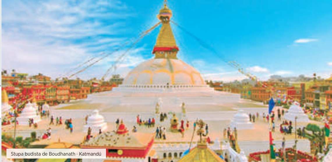
Stupa budista de Boudhanath · Katmandú