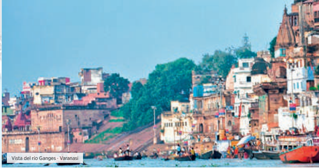
Vista del río Ganges - Varanasi