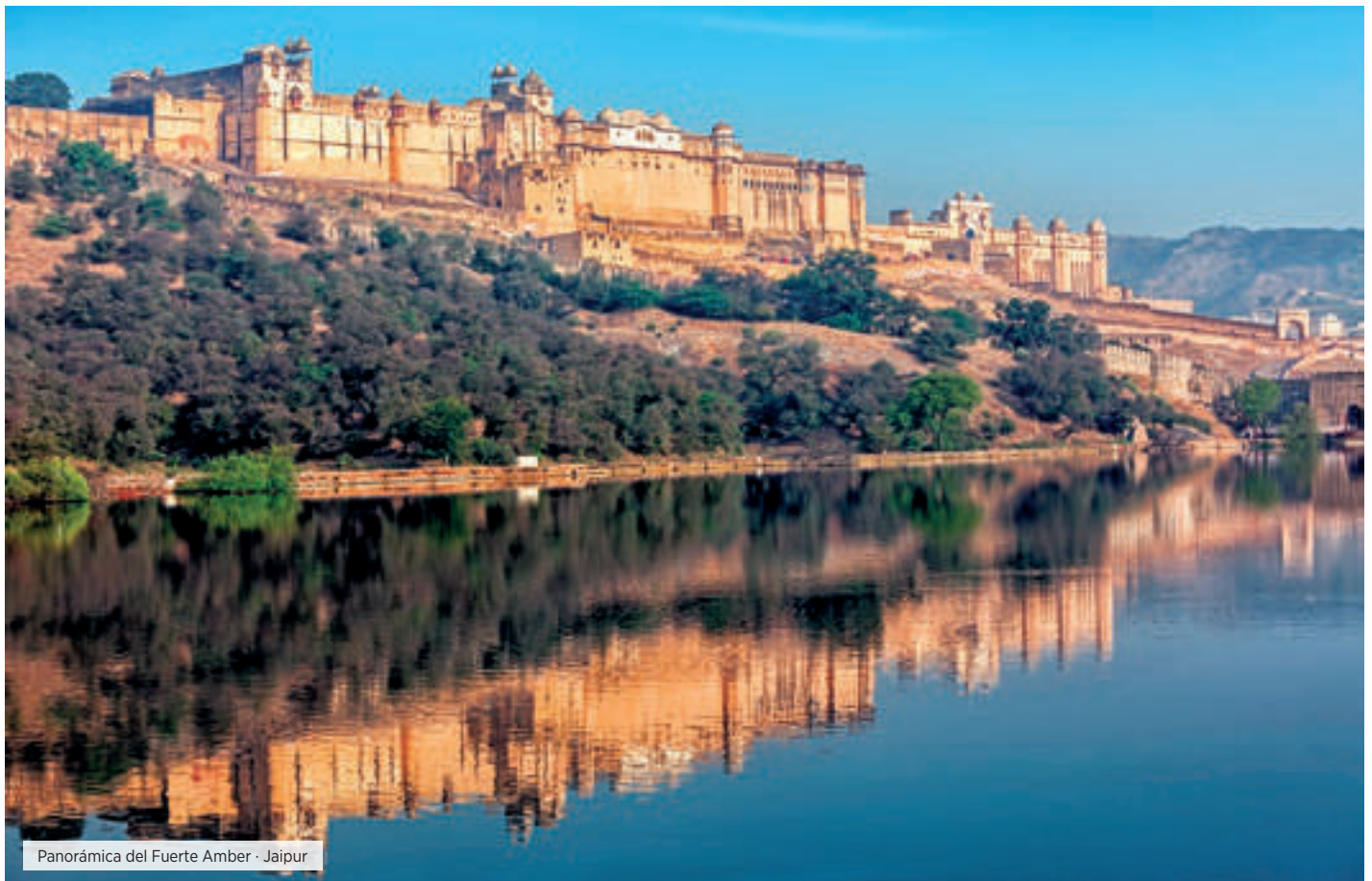
Panorámica del Fuerte Amber - Jaipur

MP Desayuno. Por la mañana, subimos al Fuerte Amber en jeep