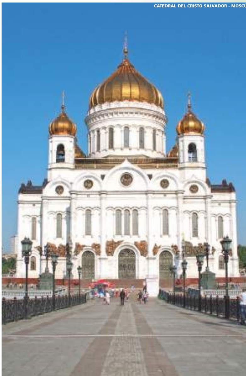
CATEDRAL DEL CRISTO SALVADOR - MOSCÚ

A la hora indicada se realizará el traslado al aeropuerto.