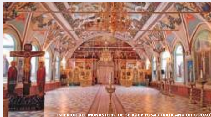
INTERIOR DEL MONASTERIO DE SERGIEV POSAD (VATICANO ORTODOXO)

A la hora indicada traslado al aeropuerto de Moscú.