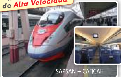
SAPSAN – САПСАН

HOTELÉS 4*/5* | PENSIÓN COMPLETA y 13 VISITAS