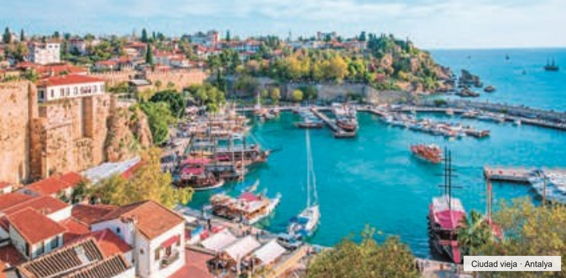
Ciudad vieja · Antalya