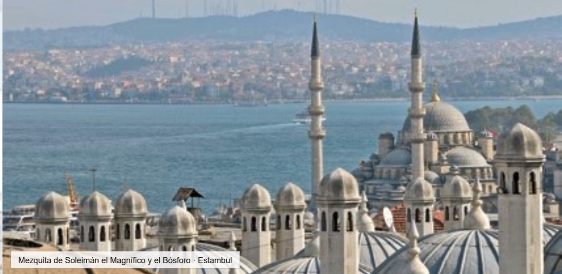
Mezquita de Soleimán el Magnífico y el Bósforo · Estambul