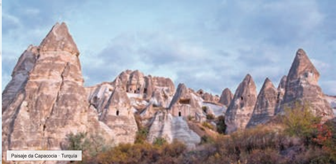
Paisaje da Capadocia · Turquía