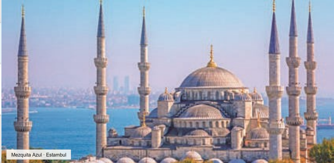
Mezquita Azul · Estambul