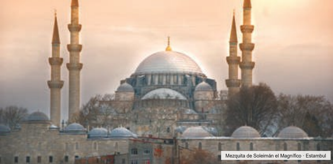
Mezquita de Soleimán el Magnífico · Estambul