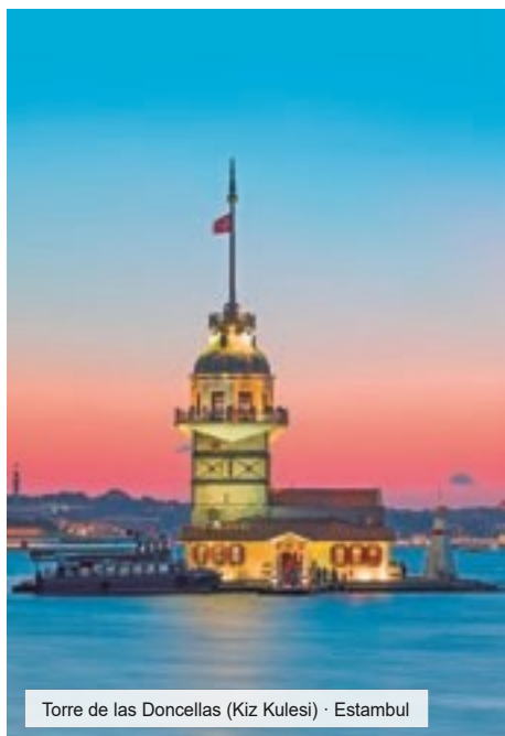
Torre de las Doncellas (Kiz Kulesi) · Estambul

Desayuno. Traslado al aeropuerto de Ataturk y Fin de nuestros servicios. ■