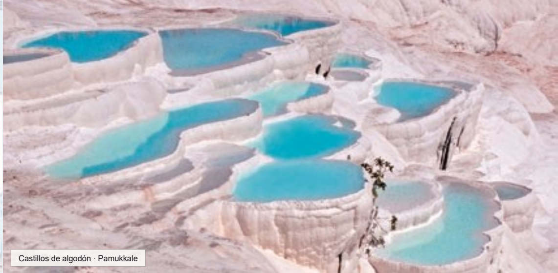
Castillos de algodón · Pamukkale