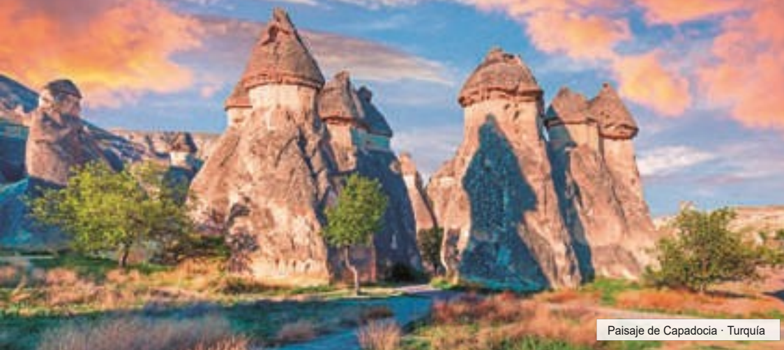
Paisaje de Capadocia · Turquía