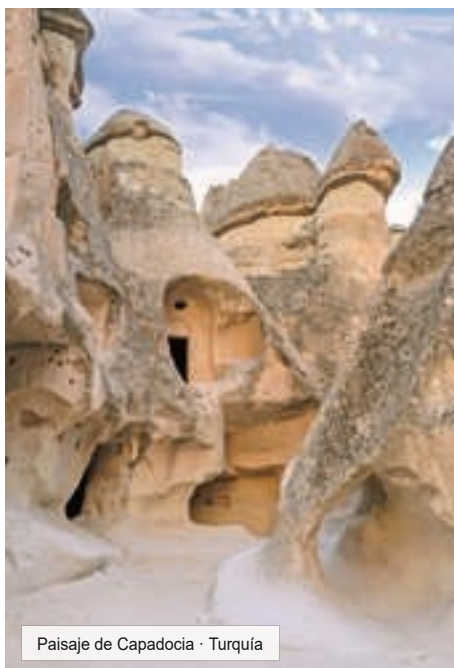
Paisaje de Capadocia · Turquía

Desayuno. Se incluye una excursión de día completo de la región de Capadocia. Visitaremos el Valle de Göreme, un increíble complejo monástico bizantino integrado por iglesias excavadas en la roca con bellísimos frescos. Visita a los impresionantes valles de la región durante la que admiraremos las conocidas "Chimeneas de las Hadas". Visita a una ciudad subterránea construida por las antiguas comunidades locales para protegerse de posibles ataques. Para finalizar, visitaremos una cooperativa donde veremos cómo se tejen las alfombras turcas. (Muy temprano se ofrece la posibilidad de realizar una excursión opcional en globo y admirar el increíble paisaje para ver amanecer). Cena y Alojamiento.