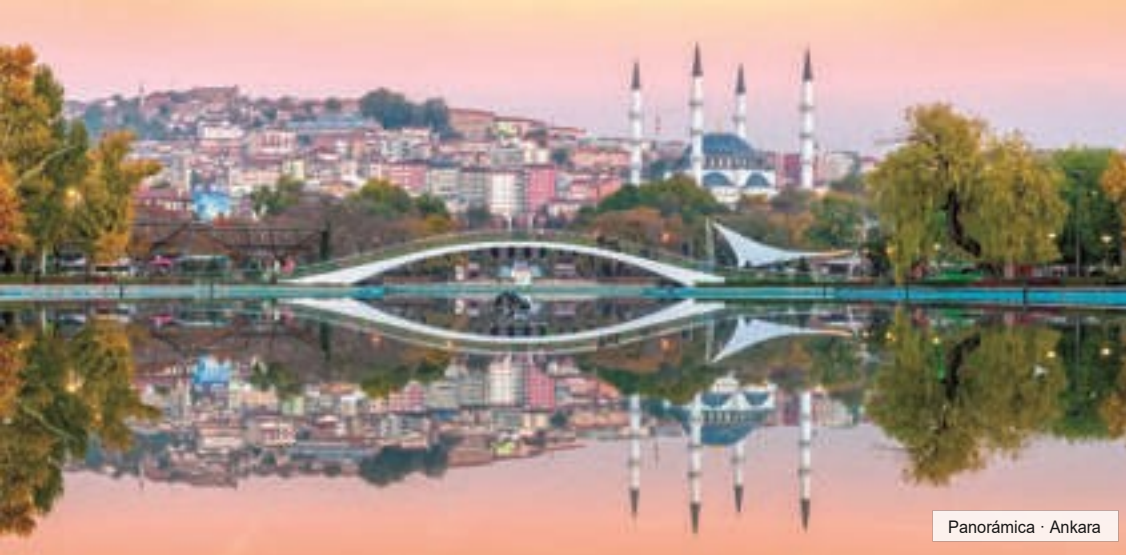
Panorámica · Ankara